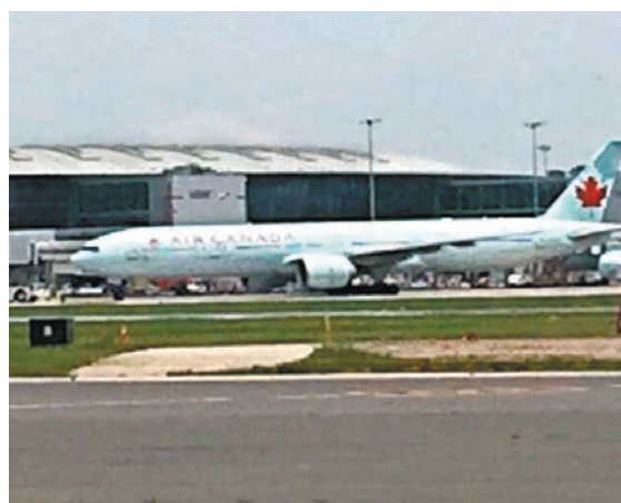
◆民事審裁處直指加航推卸責任，企圖不退款給乘客。