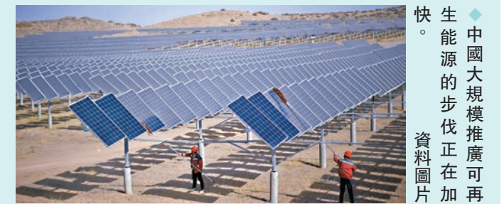
◆中國大規模推廣可再生能源的步伐正在加快。 資料圖片

分析人士認為，中國將繼續快速推廣可再生能源，預計每年繼續新增200至300吉瓦的風力和太陽能發電裝機容量。可再生能源投資已成為中國經濟的主要推動力，去年中國的清潔能源支出總額增長40%，達到8,900億美元（約6.96萬億港元）。