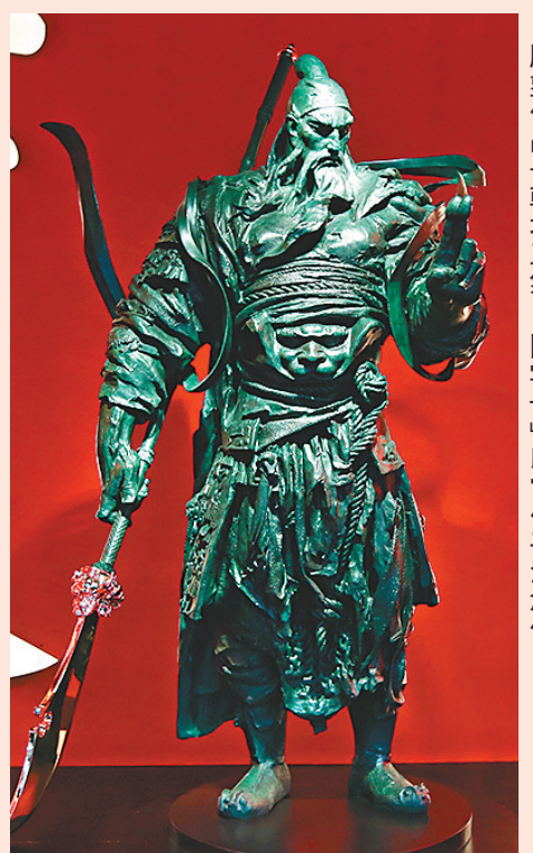
◆雕塑作品「乾坤正氣：關雲長」以當代手法創作。

另外，藝術家畢橫的裝置藝術作品「新財神」，以關公形象為藍本，由解放牌貨車改造而成，高達 9.7 米，重約 4 噸。作品將變形金剛元素與武財神關公的形象融合，將優秀傳統文化與科技發展潮流相結合，運用科技外殼表達關羽「忠義誠信」的思想內核。