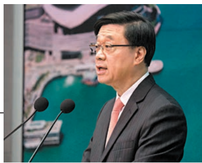
◆李家超昨日出席行政會議前會見傳媒。