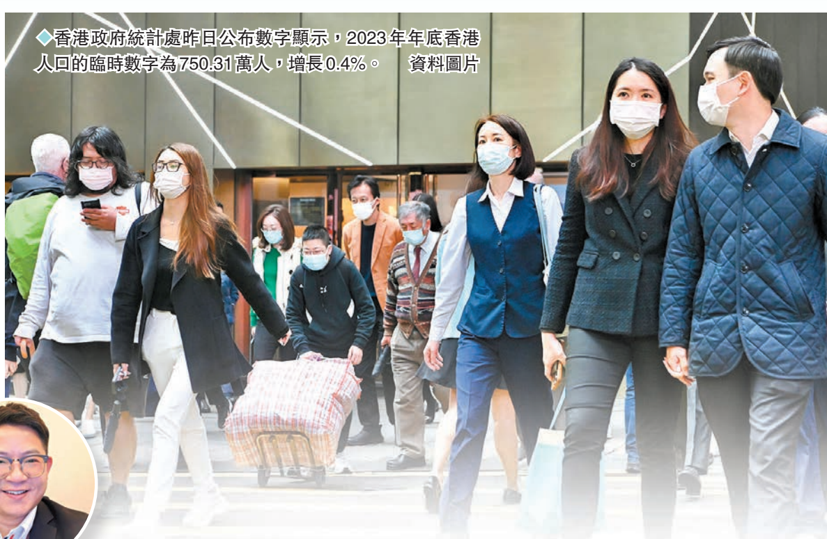
◆香港政府統計處昨日公布數字顯示，2023年年底香港人口的臨時數字為750.31萬人，增長0.4%。

香港大學社會工作及社會行政學系總監葉兆輝亦指，持「單程證」來港的人士，雖然主要是婦女與兒童，但對勞工界補充人手有幫助，長遠更能紓緩本地人口老化問題。不過他們來港後需要社會支援才能適應及融入香港社會，建議為他們提供工作及香港環境等方面的資訊，並在住屋、子女讀書等方面提供幫助。