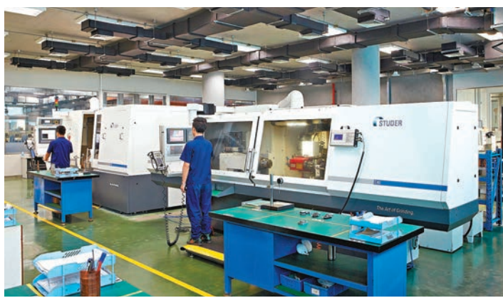
◆廣東星聯精密機械有限公司正開足馬力搶訂單、促生產。

香港文匯報訊(記者 敖敏輝 廣州報道)龍年大年初九開工第一天，廣東星聯精密機械有限公司(下稱「星聯精密」)各條生產線的技術工人緊張忙碌，智能化設備高效運轉，完成檢測的各類食品飲料磨具，下線後不久即快速發往客戶手中。擁有430多名員工的星聯精密，人手和機器實現「全員到崗」，開足馬力拚生產搶訂單。和星聯精密一樣，新年伊始，大力發展智能製造的廣東，企業全面復工復產，有不少企業整個春節假期都在開展研發和生產攻關。不少受訪企業表示，通過挖掘新賽道，打造新平台，今年訂單有望增長30%以上，有港企甚至有信心實現業績翻倍。