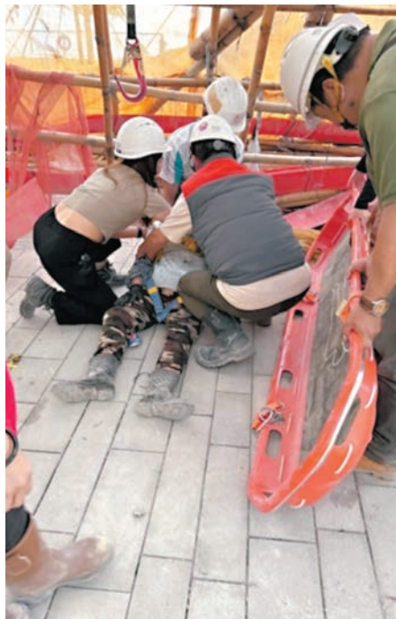
▲工友正協助拯救一名傷者。

此外，地盤進行拆卸棚架前，應先由合資格人士檢查棚架的強度及穩固性，拆卸程序亦必須計劃妥當。