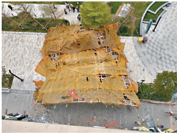
▲塌下的大幅棚架壓在地盤路中。