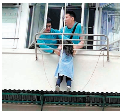
◆一名3歲女童昨晨被卡在晾衣架欄杆，兩途人出手相救。

香港文匯報訊(記者 蕭景源)深水埗一名年僅3歲女童，昨日疑被外出買菜的母親獨留在家，在攀窗往外張望時失足，跌出4樓窗