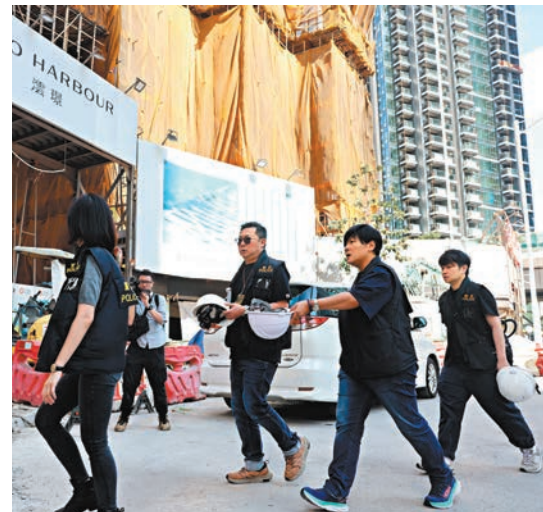
◆東九龍總區重案組探員昨日再到「漂環」地盤調查意外成因。

九龍灣啟德「漂環」地盤前日發生塌棚導致2死3傷嚴重工業意外，警方昨日聯同政府部門人員再到地盤調查事故原因，檢走一批證物。勞工處並由昨日開始，展開為期兩周巡查全港有大型棚架地盤的特別行動。有工業安全顧問估計，今次事故原因或涉及外牆用作鞏固棚架、俗稱「拉猛」的連牆器因阻礙玻璃幕牆安裝工程而被拆除有關，認為事故絕對可以避免。