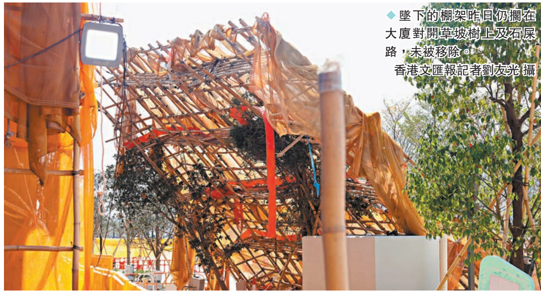
◆墜下的棚架昨日仍擱在大廈對開草坡樹上及石屎路，未被移除。