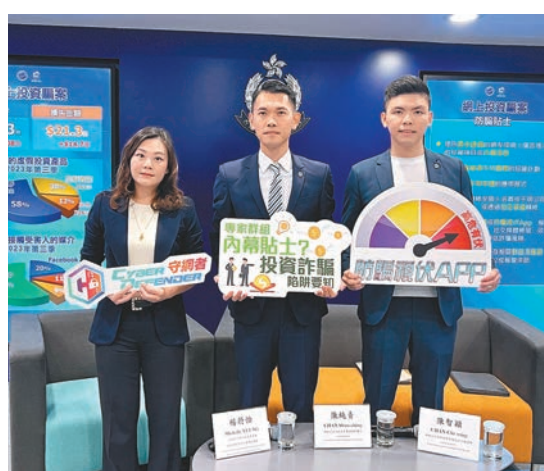
◆警方過往多次召開新聞發布會提醒市民小心網上投資騙案。 資料圖片

警方呼籲市民下載「防騙視伏App」，該應用程式將於下周一（26日）新增三大功能，包括