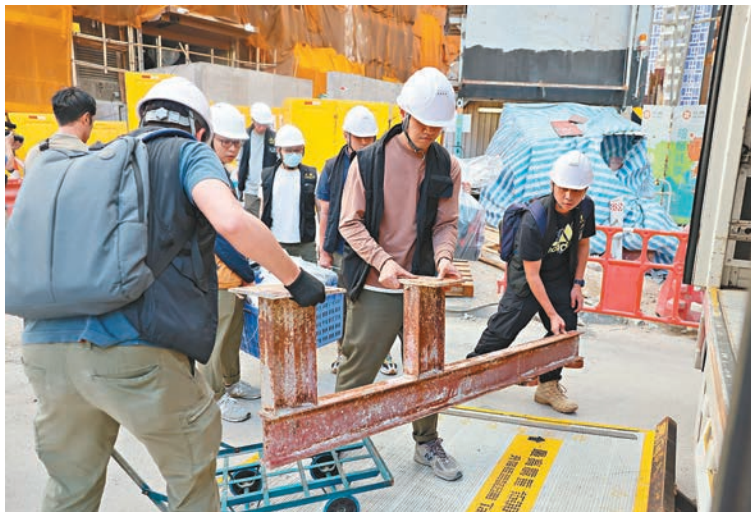
◆調查人員在地盤內檢走部分建築材料、電腦硬盤及文件等作進一步調查。