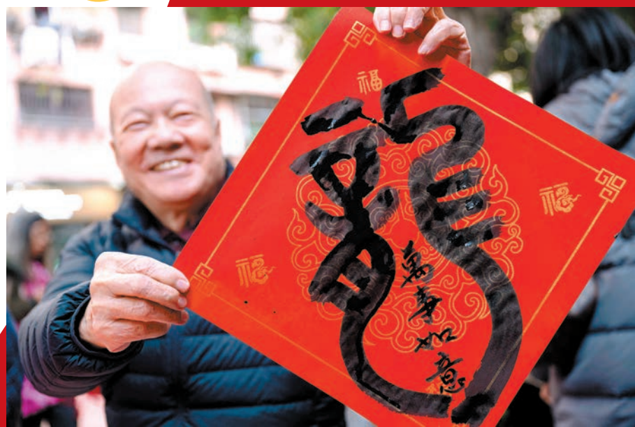
▲老人手舉「龍」字揮春迎新年。