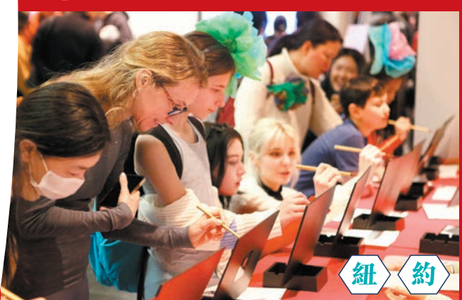
◆紐約大都會藝術博物館的參觀者在學習使用毛筆。