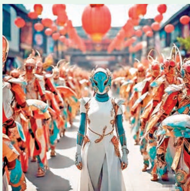
◆我們正踏入人類和AI機器一起與神魔共舞的新時代。

歷朝歷代也演變出不同種類的儺舞儺戲，伴隨着鼓鑼等打擊樂演出。演員戴着面具跳舞，動作古樸而怪異，有時看似笨拙卻又稚嫩，更會使用上刀、板凳、紙錢和咒語等各種道具，神秘感十