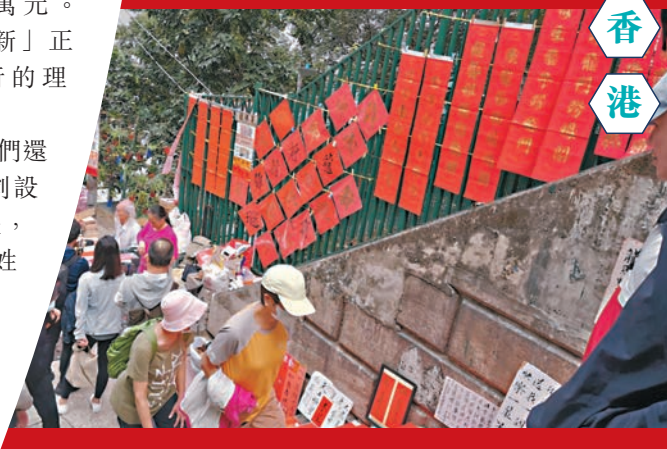
▲春節期間，樓梯上的手寫揮春欄。