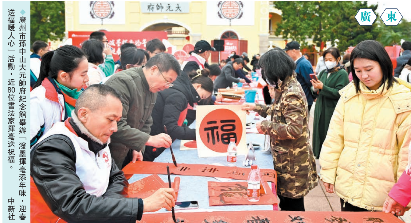
◆廣州市孫中山大元帥府紀念館舉辦「潑墨揮毫添年味，迎春送福暖人心」活動，近80位書法家揮毫送祝福。