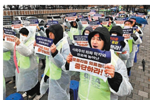
◆罷工醫生展示標語抗議。

全國醫學生代表發表聯合聲明稱，這次休學抗議行動是為保護可能因草率取得執照的醫生而受害的未來世代，以及因醫學院增額招生而無法獲得充分教育培訓的後輩，並指控政府措施不民主且高壓。