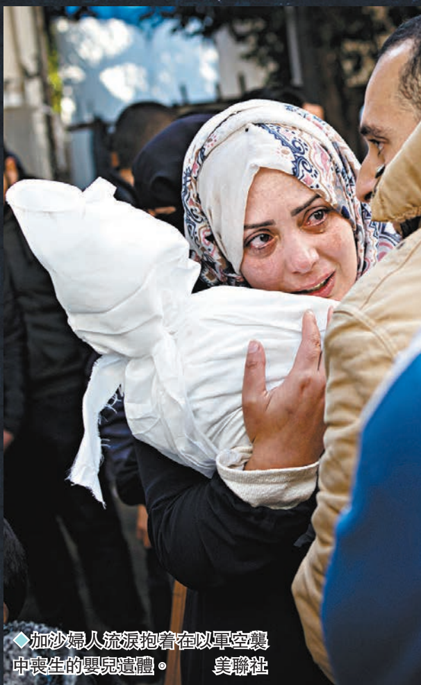
◆加沙婦人泣淚抱着在以軍空襲中喪生的嬰兒遺體。

Glan指出，英國高院的判決與國際共識不同步。荷蘭法院上周以違反國際法和人道法為由，下令荷蘭政府在7天內停止向以色列供應F-35戰機零件。在以軍開始攻擊加沙後，意大利和西班牙已停止所有對以色列的武器出口。