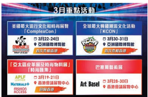
◆兩大流行文化活動將首次亮相香港。

香港文匯報訊（記者 王儂）香港國際盛事浪接浪，特區政府文化體育及旅遊局首次以「藝術三月」品牌串連推廣由特區政府舉辦、資助或支持的文化藝術盛事，讓市民和旅客對每年3月香港的文化藝術氛圍，有更深更沉的印象和感受。文化體育及旅遊局局長楊潤雄表示，今次將鼓勵旅遊、酒店、零售和餐飲業等相關行業，與文化藝術業界攜手合作，為市民和訪港旅客提供更豐富、多姿多彩的文化藝術之旅，下月不同時間安排免費派發雪糕、免費乘坐電車和天星小輪。