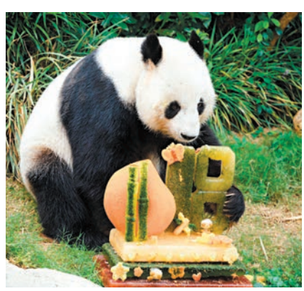
◆大熊貓樂樂剛過18歲生日。

黃嗣輝又表示，海洋公園今年年初一至初八的入場人次，較去年同期增長37%，個人遊旅客回升至疫情前的水平，當年初三的人次創疫情以來單日新高。園方觀察到團客減少，個人遊訪客比例上升，人均消費按年增長19%。