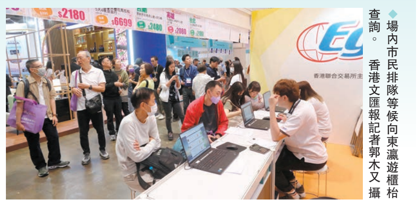
◆場內市民排隊等候向東瀛瀛櫃檯查詢。

香港文匯報訊（記者 吳健怡）全港首個旅遊嘉年華「香港旅遊博覽會2024」昨日起一連4天在香港會展中心舉行，場內設立超過300個展位，市民可即向旅行社、航空公司、各地觀光部門及旅遊體驗平台等展商購買出境旅遊產品。有參展商表示，展覽首日人流頗多，對整體生意有信心，並指香港市民的旅遊模式在疫情後趨向深度遊，並偏向往內地長線遊。