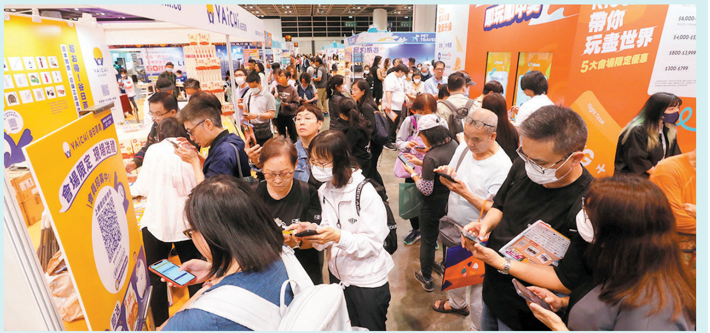
◆香港旅遊業已部署一系列的旅遊產品，把握增加個人遊城市後的商機。圖為昨日開幕的旅遊博覽會。

現時內地有49個城市的居民可以個人遊來港，主要為一線城市。特區政府文化體育及旅遊局局長楊潤雄昨日在立法會表示，內地仍是香港最主要的旅客來源地，維持在總旅客的八成，對香港旅遊業起舉足輕重的作用，特區政府一直有跟內地相關部門商討便利內地旅客來港旅遊的方案，「例如會否增加自由行（個人遊）城市，或增加內地旅客個人自用進境物品免稅額等與內地其他部委商討。」