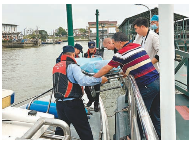
◆工作人員運送島內一名患者出島。