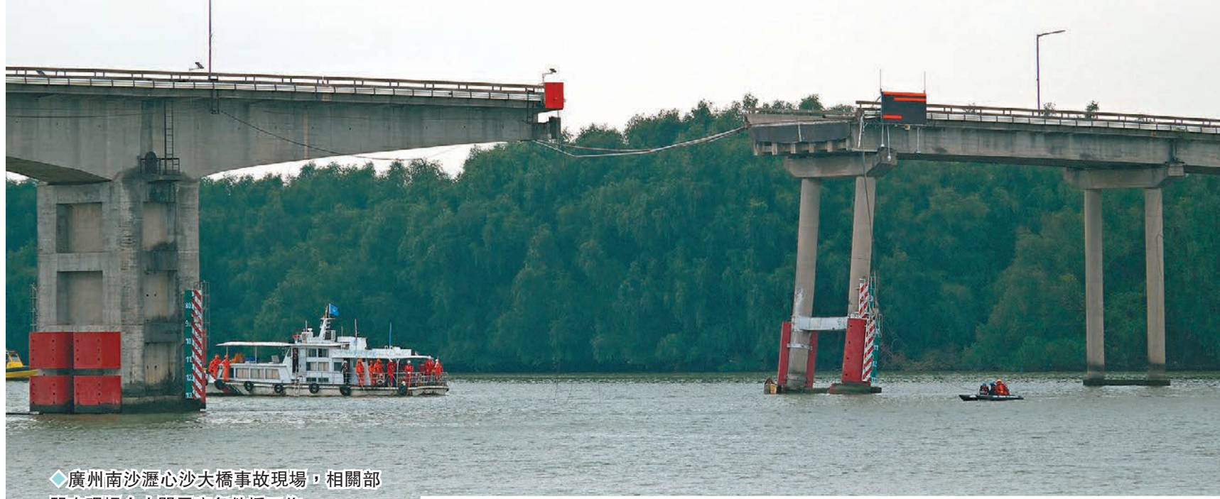
◆廣州南沙瀝心沙大橋事故現場，相關部門在現場全力開展應急救援工作。

香港文匯報訊（記者 黃寶儀、帥誠、盧靜怡 廣州報道）距離元宵節尚有兩天，南沙巴士司機梁金華像往日一樣凌晨出門，駕駛頭班車前往到始發站，不料這竟成為了他人生的最後一班車。22日清晨5點30分左右，佛山籍貨櫃船「良輝688」輪在經過瀝心沙大橋，船身和船頭兩度撞擊橋墩，導致航孔上的橋面斷裂，正在駕駛大巴的梁師傅連人帶車墜落橋下。搜救部門在事故後展開海陸空立體式救援。經過12小時的救援，奇跡並沒有出現。官方在下午的發布會通報稱，事故因涉事船員操作失當所致，共造成四輛車和一輛電動摩托車墜落，包括梁司機在內的五人遇難。目前，肇事船主已被控制。廣東海事局已成立事故調查組開展調查取證。