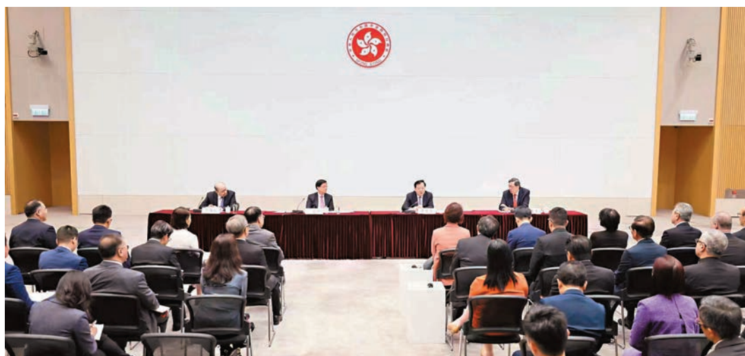
◆夏寶龍昨日與立法會主席及議員代表見面交流。