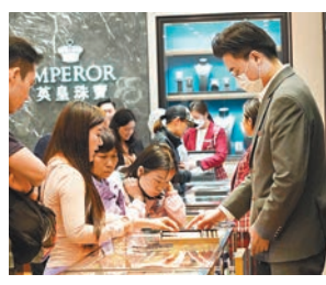
▲ 隨著內地增加更多個人遊城市，業界料旅遊相關消費將更興旺。

國家出入境管理局在公告中宣布，西安市和青島市戶籍居民以及居住證持有人，可以在西安市、青島市公安局出入境管理人工窗口，或設在人工窗口的智能簽註設備提交申請，自行選擇辦理「個人旅遊簽註」或「團隊旅遊簽註」，免予提交申請事由材料。「個人旅遊簽註」包括赴香港三個月一次簽註、三個月兩次簽註、一年一次簽註、一年兩次簽註；赴澳門三個月一次簽註、一年一次簽註。簽註持有人每次可以在香港或者澳門逗留不超過7天。