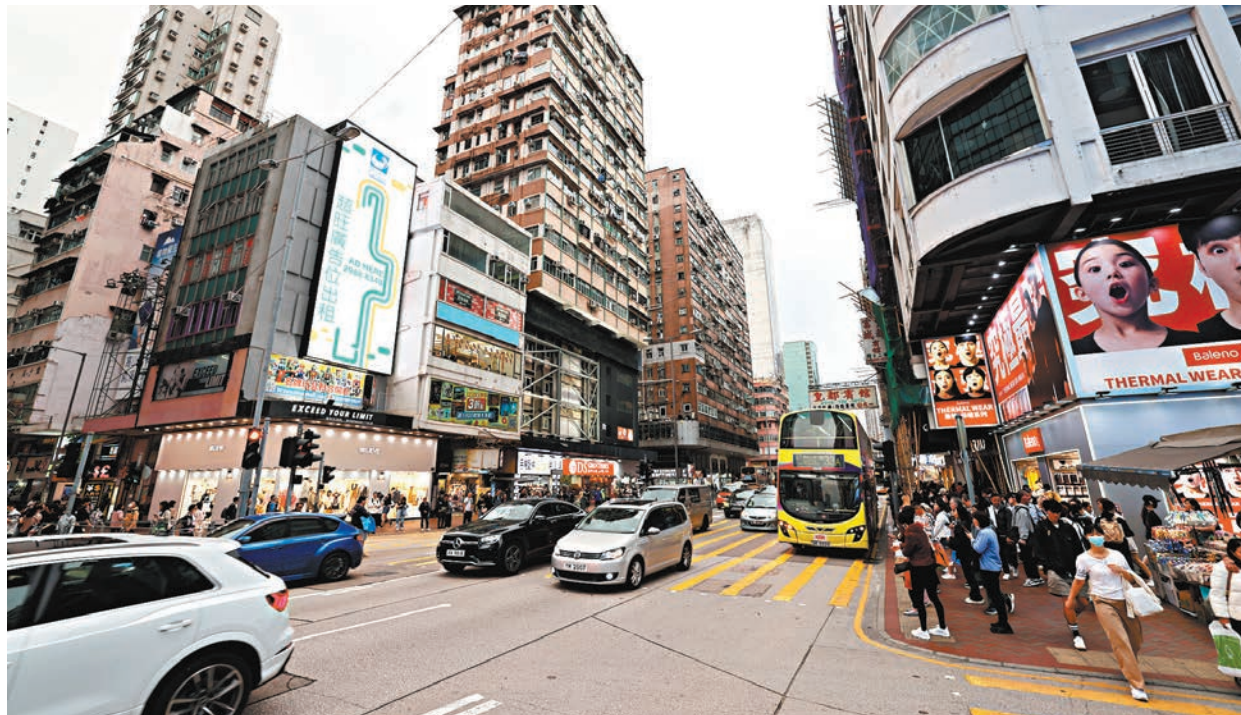
◆警方揀選人流及旅客較多的旺角區，下月率先安裝15組閉路電視鏡頭。

為配合「地區治理專組」的優先工作，以進一步提升治安水平及全面打擊罪案，特區政府早前公布在各區安裝2,000組閉路電視。保安局昨日向立法會提交文件，透露現階段計劃在全港18區的615個位置安裝閉路電視。旺角將於下月率先安裝15組鏡頭作技術測試，本年中正式開展其餘600組閉路電視鏡頭的安裝計劃。現階段閉路電視並無追蹤功能，而所有錄影片段，均會於錄影日期起計30日後自動刪除。有油尖旺區議員歡迎落實計劃，特別是旺角區人流較多，安裝鏡頭可以有效防止罪案及協助警方查案。 ◆香港文匯報記者 蕭景源