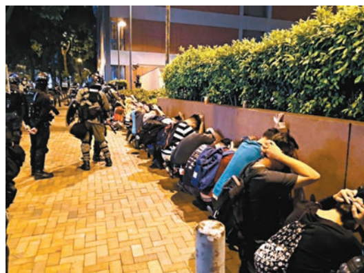
◆當晚大批暴徒企圖離開理大即被警方拘捕。 資料圖片

潘官強調，原審法官的裁決是基於已確立的事實，並非臆測。控方由始至終均是憑藉環境證供，要求法庭作出申請人在關鍵時刻參與了暴動的唯一合理推論，原審法官席前所有的環境證供的疊加效應完全是壓倒性的，完全可供原審法官作出申請人參與了暴動的唯一合理推論，從而再作出申請人在該兩天藉着逗留在理大，鼓吹他人持續參與暴動，故具有參與的意