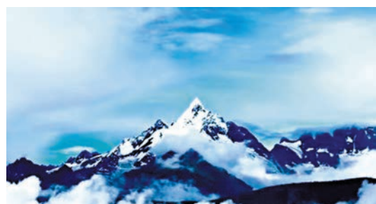
◆世界最美雪山——梅里雪山。

神奇的梅里，在一年中很多時間都為濃霧所覆蓋，多少攝影家千里迢迢飛來拍攝梅里，梅里都羞答答幾天不開面，似乎要永遠躲在濃霧之間。然而觀賞梅里的樂趣也許就在這裏，這個時節的梅里變幻多端，時不時露出嶄新的頭角，讓人一