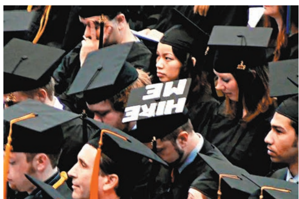
◆就讀課程的低收入家庭學生難獲高收入。