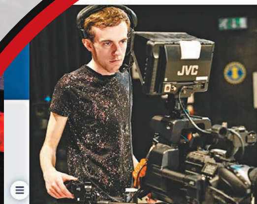
▲侯城大學的媒體、新聞及傳播學位為「全英最米奇老鼠」的學位。

香港文匯報訊 英國媒體經常以「米奇老鼠學位」(Mickey Mouse degree)，形容學生修讀後難尋出路的無用學位。《每日郵報》周三(2月21日)報道，根據英國教育部數據統計「全英最米奇老鼠的學位」，顯示修讀該課程的學生在畢業5年後，報酬只及最低薪酬水平，還面臨高額學貸負擔，實際成本高達9.5萬英鎊(約94萬港元)。英國政府早前承諾會打擊這些低質素課程，但分析認為英國教育產業化背景下，大學為賺取更多收入，米奇老鼠學位問題料難在短期內解決。