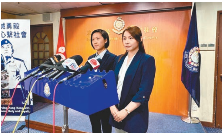
◆警方講述拘捕「淋液怪客」案件詳情。

香港文匯報訊（記者 蕭景源）一名「淋液怪客」近月在旺角鬧市向女途人臀部淋不明液體，有受害人在網上開設關注「向私密部位潑灑不明液體」專頁，累計收集到過去數年共百餘名受害者有相同遭遇，顯示去年至今案發更趨頻密。其中，旺角區是犯案黑點，旺角警區在最近一個月接獲9宗報案，經調查鎖定一名56歲男子。當疑犯前日在銅鑼灣向一名少女潑液時，在場埋伏的探員即將之拘捕，並檢獲一個載有不明液體的保溫壺，成份有待化驗確定。初步調查，該疑犯最少涉及13宗同類案件，警方呼籲尚未報案受害人或目擊者與調查人員聯絡。