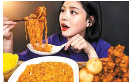
很多韓國網紅喜拍暴飲暴食影片。網上圖片

挪威政府早於2021年7月通過立法，要求網上活躍的挪威名人和網紅在社媒發布的廣告內容中，若對身體形狀、大小、臉型或皮膚進行了修飾，須加上政府部門指定的標籤標記。如果沒有標註也不承認「P圖」，將被處以罰款。以色列、法國、加拿大和澳洲都有類似的修圖加標籤要求。