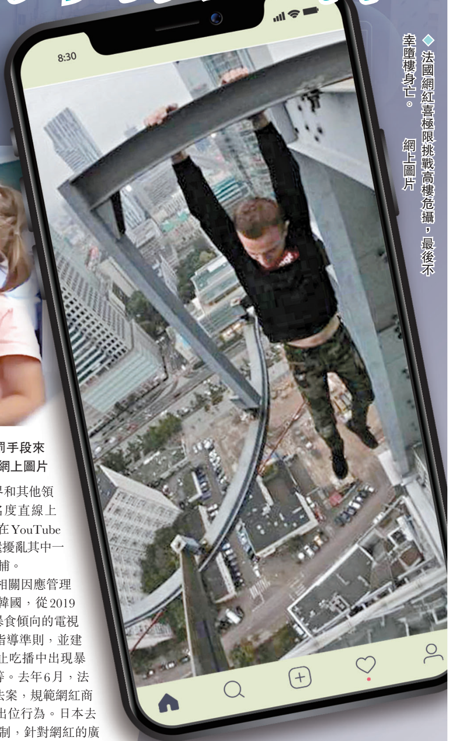
法國網紅喜極而泣挑戰高樓危攝，最後不幸墮樓身亡。網上圖片

對於網紅銷售軍用催淚彈，《朝鮮日報》解釋稱，儘管韓國現行槍炮、刀劍、火藥類等管制法中，沒有對催淚彈或催淚液本身的管制規定，但向他人或在公共場所引爆催淚彈時，可能會受到處罰。據報道，在過去的案例中，一名韓國議員因引爆催淚彈被判刑。