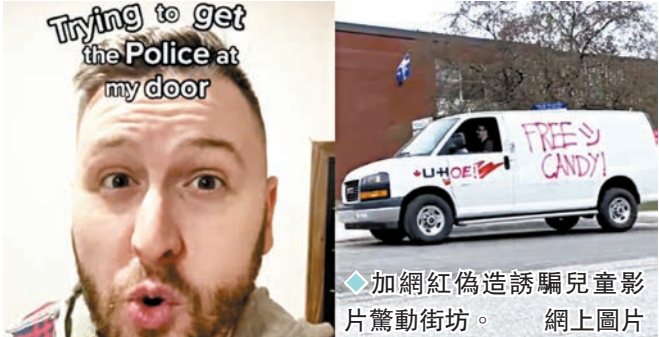
加網紅偽造誘騙兒童影片驚動街坊。

演在柬埔寨詐騙園區被綁架毆打，被東方判刑兩年。為打擊有關網紅越界亂象，各地政府均採取措施加強監管，並探討相關立法問題。