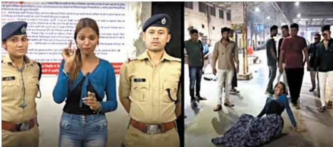
印度網紅在孟買火車站跳舞阻街，其後發影片公開道歉。

美國剛審判一宗虐兒事件，以育兒影片聞名的YouTube育兒網誌作家弗蘭克，因虐待兒童罪被判監30年。弗蘭克先前在YouTube上擁有超過200萬粉絲，她的頻道向粉絲和網民提供育兒經驗。但在她的影片中，弗蘭克以極嚴厲的懲罰手段來「教育」孩子，包括剋制食物等。弗蘭克雖被判刑，但輿論仍擔憂其影片產生的模仿效應。《衛報》評論稱，弗蘭克的影片被觀看了10億次，「她在世界各地明目張膽『兜售殘忍』，一想到她將虐待兒童正常化，就令人不寒而慄。」