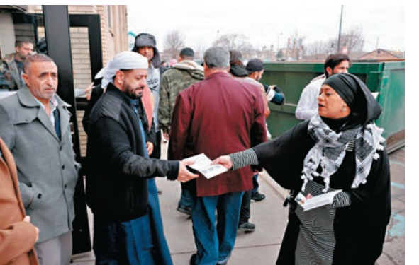
◆密歇根州反對拜登人士向民眾派傳單，呼籲不要投票給拜登。

「傾聽密歇根」組織也發起集會，抗議拜登在巴以衝突中的立場，該組織本月已舉行多場集會，拜訪了該州許多清真寺。此外，拜登還面臨「放棄拜登」運動的反對，該運動有來自 7 個州份包括密歇根州的支持者參與，他們承諾不會在 11 月大選投票給拜登。