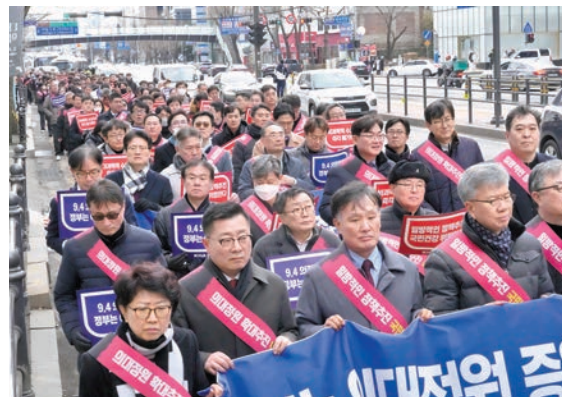
◆韓政府警告罷工醫生需於周四前重返職位，否則會「釘牌」至少 3 個月。

團體領導人的調查。首爾警察廳廳長趙志浩表示，警方主要調查對象包括支持罷工的「大韓醫生協會」，以及「大韓實習駐院醫生協會」負責人。當地醫生團體計劃下月 3 日舉行大規模集會抗議，警方稱若集會上發生任何非法行為，將採取制裁措施。