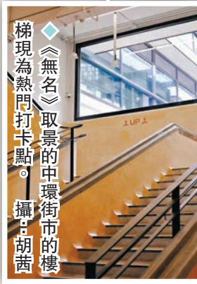
《無名》取景的中環街市的樓梯現為熱門打卡點。

有逾170年歷史的中環街市，由香港開埠到經歷戰亂、經濟起飛到香港回歸，經過多年變遷、爭論及活化，終於趕上時代步伐，以嶄新姿態重現人前，再度成為中環一道重要風景。街市於2021年8月23日開幕試業，活化成了現在的樣子。今天的中環街市，聚集了特色食肆、在地品牌、文青小店，以及生活雜貨等，成為了一個新興景點，同時還是藝術家集中的文化沙龍，不時舉辦藝文展覽。那些戰火中的硝煙，到了今天，終究化作一縷縷青煙，在鏡頭下蔓延。