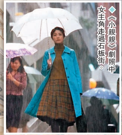
《小親親》劇照中女主角走過石板街。