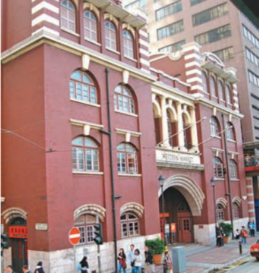
◆上環環輔道中323號的香港西港城是法定古蹟。

2008年電影《証人》和去年電影《4拍4家庭》皆在富有文藝氣息的中環藝穗會取景。「4拍4」中最後Uncle Anson的Fringe Bar就是這個由1983年轉變為藝術空間的地方。去年由梁朝偉和劉德華主演的劇情片《金手指》也在西港城取過景，西港城也在畫面特殊處理、演員妝容的襯托下，被蒙上了東歐的氛圍。香港風景也頻頻出現在外國大片上。《變形金剛4：絕跡重生》的拍攝地貫穿青馬大橋、中環擺花街、灣仔香港會議展覽中心、九龍深水埗舊樓區、香港東方文化酒店等地。影片中充斥着帶有鐵柵欄的香港老式電梯。其中史丹利·圖齊等人為了躲避大反派「驚破天」的追殺，在慌亂中躲入一個桌上散滿麻將的玻璃房子。這座房子，就在香港的東方文華酒店中。《環太平洋》的拍攝也經過上環、中環、灣仔、青馬大橋、維多利亞港等地。片中鱗次櫛比的高樓大廈、擁擠的街道、各色霓虹燈，無一不散發着濃濃的港味。尤其是在青馬大橋拍攝的「雨中大戰」，翻騰的海水和半毀的大橋，給在海中大戰的機甲戰士帶來幾分悲愴。