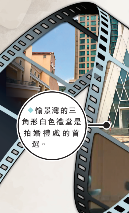
愉景灣的三角形白色禮堂是拍婚禮戲的首選。