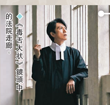
《毒舌大狀》鏡頭中的法院走廊。

另一著名景點便是戲中董衛國跟金遠山商討案件的地點——大坑一級歷史建築虎豹別墅。虎豹別墅於2009年被評為一級歷史建築，其後活化成「虎豹樂園」，是香港一處開放的古老建築，至今仍供遊人參觀。新晉年輕導演朱智立說：「香港是一個非常立體且地理層次豐富的城市，所以本身非常適合電影的取景，這一點在無數的經典港片中早已得到了驗證。香港雖小，但其實還隱藏許多可以在視覺上去挖掘的空間，更何況這裏是中西文化交匯之地；許多獨特的視覺景觀，在世界上都是獨一無二的，值得電影人繼續用影像去發現。」