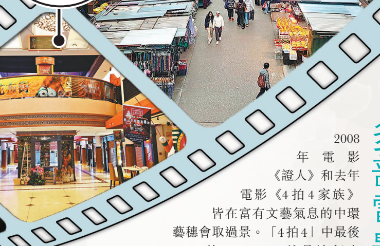
◆西港城建於1906年，內裏古色古香，是《金手指》取景地。

2008年電影《証人》和去年電影《4拍4家庭》皆在富有文藝氣息的中環藝穗會取景。「4拍4」中最後Uncle Anson的Fringe Bar就是這個由1983年轉變為藝術空間的地方。去年由梁朝偉和劉德華主演的劇情片《金手指》也在西港城取過景，西港城也在畫面特殊處理、演員妝容的襯托下，被蒙上了東歐的氛圍。香港風景也頻頻出現在外國大片上。《變形金剛4：絕跡重生》的拍攝地貫穿青馬大橋、中環擺花街、灣仔香港會議展覽中心、九龍深水埗舊樓區、香港東方文化酒店等地。影片中充斥着帶有鐵柵欄的香港老式電梯。其中史丹利·圖齊等人為了躲避大反派「驚破天」的追殺，在慌亂中躲入一個桌上散滿麻將的玻璃房子。這座房子，就在香港的東方文華酒店中。《環太平洋》的拍攝也經過上環、中環、灣仔、青馬大橋、維多利亞港等地。片中鱗次櫛比的高樓大廈、擁擠的街道、各色霓虹燈，無一不散發着濃濃的港味。尤其是在青馬大橋拍攝的「雨中大戰」，翻騰的海水和半毀的大橋，給在海中大戰的機甲戰士帶來幾分悲愴。