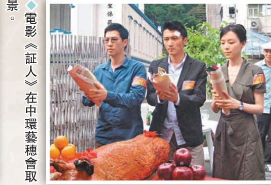
電影《証人》在中環藝穗會取景。