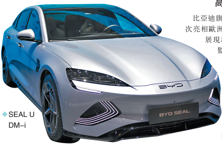
◆SEAL U DM-i

在日內瓦車展上，比亞迪首次向歐洲展示自主研发的DM-i混動技術，並亮相搭載此技術的車款「宋PLUS DM-i」（海外版命名為SEAL U DM-i）。