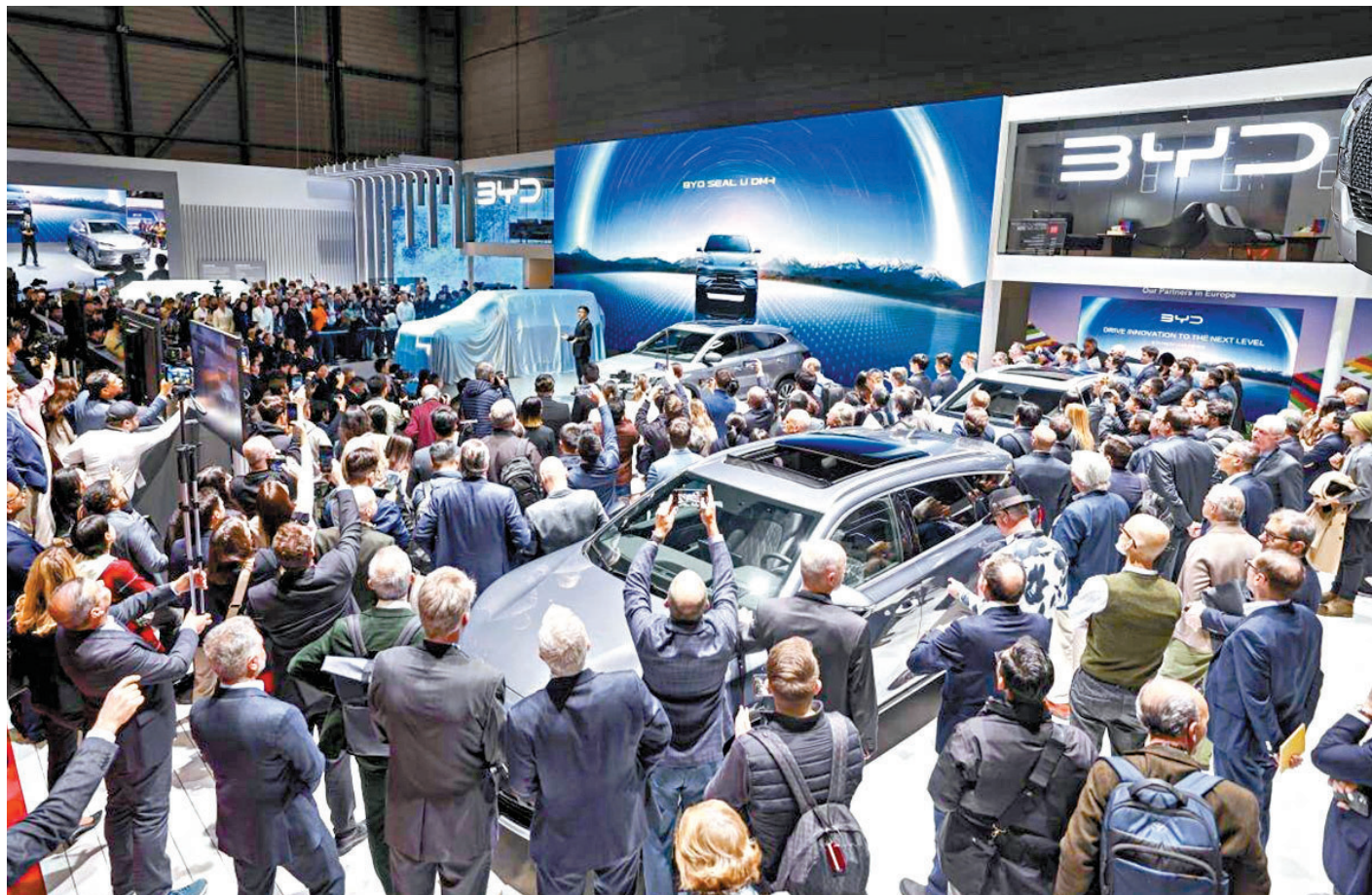
◆比亞迪攜8款新能源車型亮相日內瓦車展，成為全場焦點。網上圖片

香港文匯報訊 全球知名5大車展之一的瑞士日內瓦車展，周一（2月26日）正式開幕。中國大型車企比亞迪攜同8款新能源車型亮相，成為全場焦點，進一步拓展其全球布局，加速中國新能源汽車全球化進程。彭博社分析指出，今次車展讓歐洲傳統車廠與聚焦電動車的中國車企同場較勁，隨着中國車企挾着低價車款壓境歐洲市場，迫使歐洲車廠降低成本，無論是歐洲車廠或是他們的供應商，勢必面臨艱難的一年。