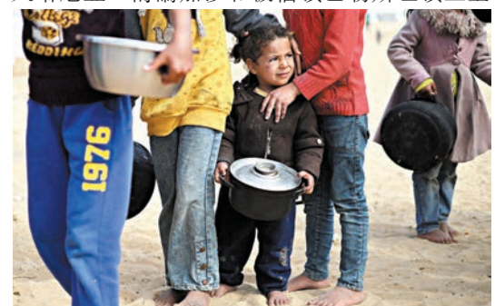
◆加沙巴勒斯坦兒童等待領取食物。

卡塔爾通訊社報道，卡塔爾埃米爾塔米姆周一（2月26日）在多哈會見哈馬斯政治局領導人哈尼亞，討論加沙和被佔領巴勒斯坦領土上