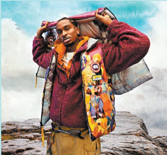
◆Shai Gilgeous-Alexander 演繹全新聯乘系列