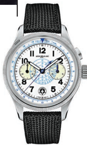
▲1858 Minerva 單按把計時腕錶

另外，品牌與 Collective Horology 第八次合作，攜手推出 1858 Minerva 單按把計時腕錶，向品牌的經典運動碼錶致敬。腕錶的錶盤上飾有 Minerva 標誌，僅限量發行30枚。Collective 被 Montblanc 的製錶工藝、獨特設計，以及標誌性的複雜功能所吸引，如 Geosphere 的世界時間和 Nicolas Rieussec 的計時功能等。