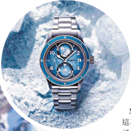
▲Montblanc 1858 Geosphere 0 Oxygen South Pole 限量版腕錶