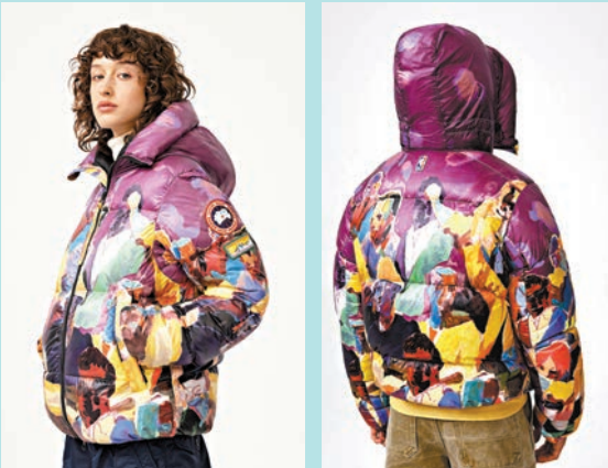
◆「紫色人群」圖樣的 KidSuper Crofton 羽絨外套