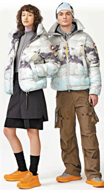
◆印有「風景」外觀的羽絨設計

專為品牌設計的，前者描繪了體育館內球迷的熱情和興奮，藉運動向人與人之間的聯繫致敬；後者則勾勒出巍峨的雪山和結冰的溪流，呼應品牌「心向無界（Live in the Open）」的理念。例如採用亮面的 Feather-Light Ripstop 面料（100% 再生尼龍）製成的 KidSuper Crofton 羽絨外套有「紫色人群（Purple Crowd）」與「風景（Landscape）」兩種印花可供選擇，衣物內裏填充物超輕，配有可調節羽絨帽、防風擋片和雙向拉鍊等，用途廣泛，易於隨身攜帶。