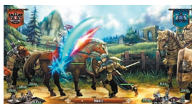
◆《聖獸之王》體驗版已全線發布中。

得100萬美元冠軍獎金，但他仍可獲得30萬美元（約234萬港元），乃香港近年最佳的《街霸》比賽成績。