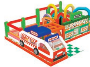
▲美食街樂園 ▲智脆菠蘿油迷宮