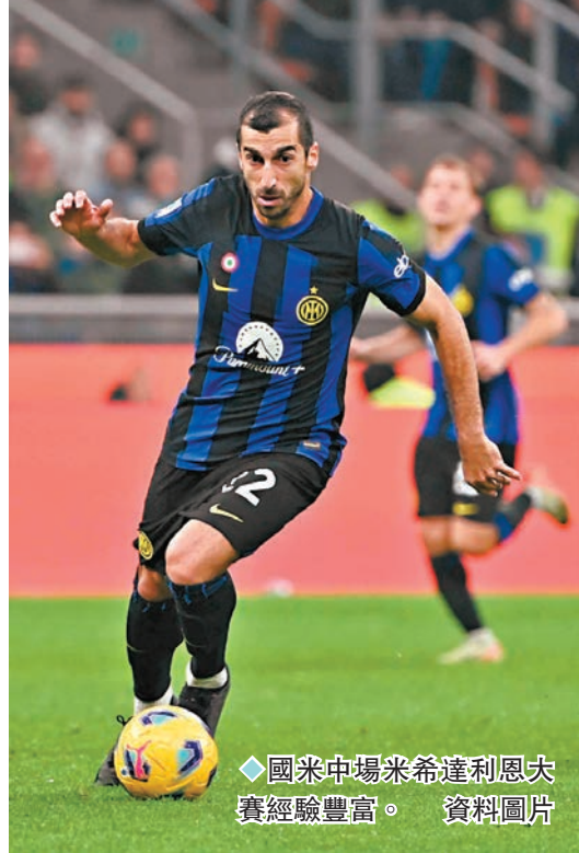
◆國米中場米希達利恩大賽經驗豐富。

而昨日凌晨第26輪角逐，首都雙雄卻是一喜一悲，「紅狼」羅馬憑藉阿根廷球星保羅戴巴拿連中三元，包括一球12碼以及一記30碼外的世界波，以3：2擊退拖連奴，穩守第6位；拉素則遭費倫天拿逆轉輸1：2，被後者超越跌落第8位。