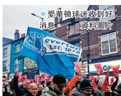
◆愛華頓球迷收到好消息。

香港文匯報訊（記者 梁志達）因違反英超財務規則英超被扣10分的愛華頓，在上訴後獲減刑至扣6分，在積分榜上即由倒數第四位升了兩位。去年11月，愛華頓被指在截至2021/22賽季的評估期內超出了英超盈利能力和可持續發展規則允許的1,950萬英鎊虧損，因此被罰分。獨立上訴委員會認為，在兩個入罪理由中其中兩項犯了「法律錯誤」，故愛華頓獲得減刑。