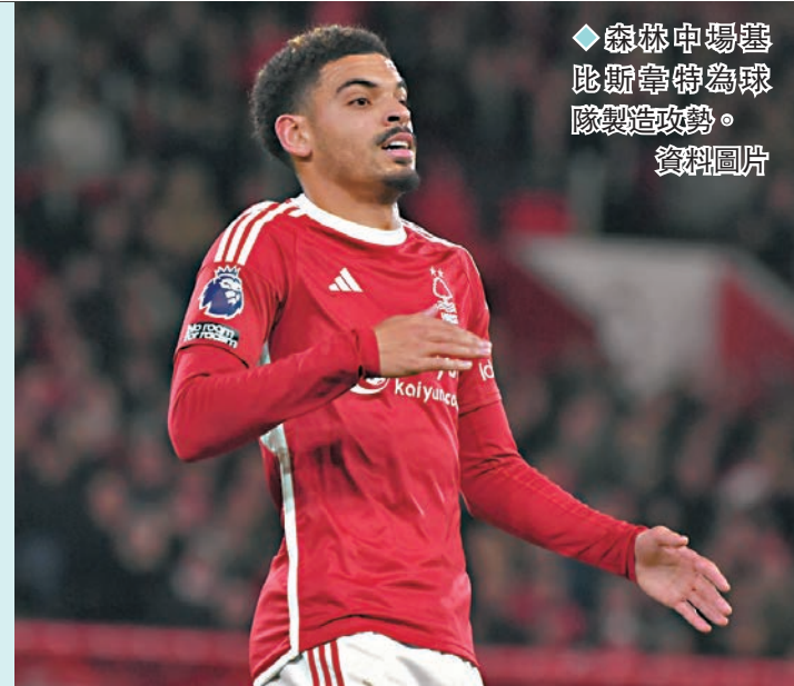
◆森林中場基斯韋特為球隊製造攻勢。資料圖片