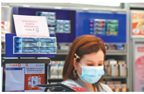
◆煙草稅即日起加32%，香煙零售價每包加16元。

今次是政府連續第二年增加煙稅，去年每支煙的稅款上調0.6元，加幅31.48%，今年加幅則為31.92%。政府消息人士指出，以市面常見一包香煙20支計算，去年加稅後每包香煙稅款為50.12元，平均零售價77.69元，煙草稅佔香煙零售價的比例約為65%。今次加煙稅後，每包香煙的稅款為66.12元，估計平均零售價為93.68元，當中71%為稅款。