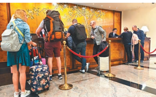
◆酒店房租稅明年元旦起復收3%。