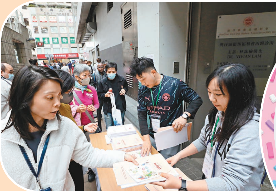
◆年薪500萬元以上的部分，薪俸稅率由15%增至16%。圖為市民爭相索取財政預算案。