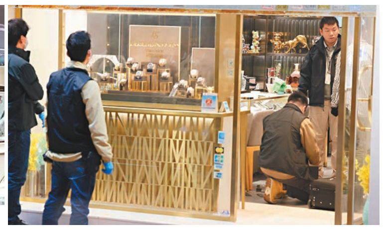
網上短片截圖 ◆探員到場搜證，店內飾櫃被擊毀。

名匪徒則將名錶放入手提袋，匪徒整個犯案過程僅約46秒完成，3匪奪門逃出，登上私家車逃走。警方接報到場兜截，但未有發現，錶行初步點算損失約30隻名錶，總值約600萬元至800萬元。