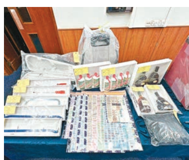
◆涉及白田商場酒家遭爆竊檢獲的證物。

另在本周（25日）深水埗白田商場一間酒樓亦遭爆竊，失去夾萬內10萬元現金及玻璃櫃內18支約值2萬元名酒。警方經調查，發現當日凌晨有兩名賊人撬開酒樓後門進入犯案，