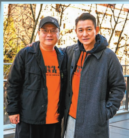
◆寧浩（左）斗膽將華仔的現實生活搬到電影中。

放下得失之心：「因為我真的有很多最後是沒拿到獎項。《瘦身男女》我記得我輸的原因是因為『瘦回來』，被說我要帥及有偶像包袱，我也沒話說啊。」華仔補充指不管拿多少次影帝獎，總會有人批評，因為那些既定的感覺很難去磨滅和改變，自己亦不用太介意，他自言與劇中角色一樣都是一個普通人，一樣會有懷疑自己的時候，相信觀眾看畢電影，會更明白影星風光背後的故事和心態。