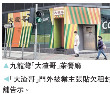
▲ 九龍灣「大渣哥」茶餐廳 ▲ 「大渣哥」門外被業主張貼欠租封舖告示。