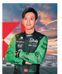
◆周冠宇新賽季賽車服。

香港文匯報訊 (記者 夏微 上海報導) 29日，滙豐中國宣布，其與中國首位F1車手周冠宇的合作迎來全面升級，從2024賽季開始，已擔任「滙豐中國品牌大使」兩年的周冠宇將成為「滙豐品牌大使」，品牌標識也將成周冠宇賽車服所展示的品牌之一。