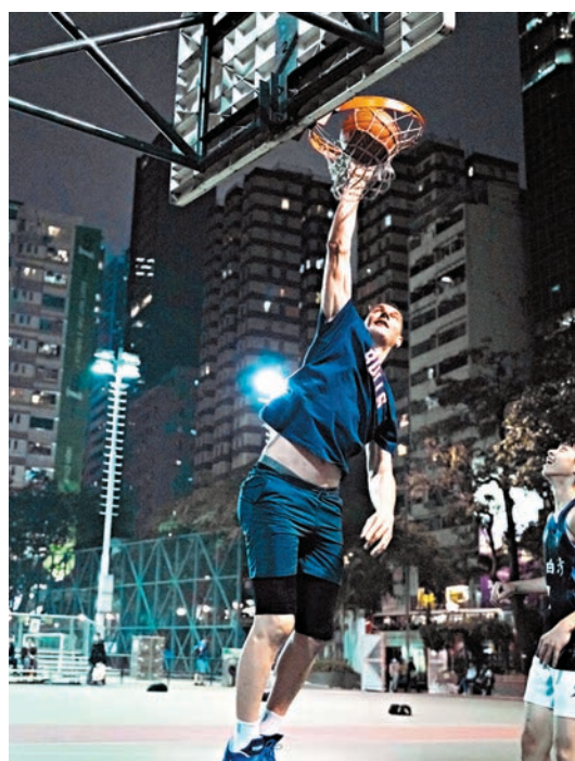
◆德古拉快閃修頓與球迷近距離接觸。

德古拉成為球隊大使後，除了會繼續快閃走入街頭與香港球迷「鬥波」外，更會參與香港金牛其他社區活動，包括校園訪問、地區慈善探訪，協助球隊執行推廣本地籃球、回饋社會的任務。