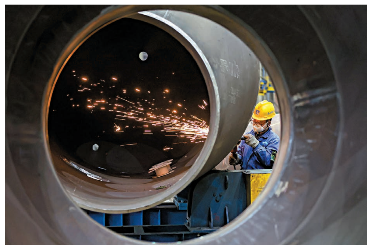
◆ 國家統計局最新發布的2月製造業採購經理指數（PMI）錄得49.1%，較1月小幅回落0.1個百分點。圖為2月29日，江蘇南京一工程裝備製造企業，工人在生產線上忙碌工作。

浙商證券首席經濟學家李超認為，PMI季節性回落，主要受春節假期影響，2月企業有效開工天數較少；不過，服務業景氣度改善幅度較大，春節期間居民出行強度較高，走親訪友、旅遊出行、文化娛樂等消費場景活躍，居民消費潛力得到了充分釋放。「隨着節後開工率回升，1萬億元增發國債、支持三大工程的新增抵押補充貸款等穩增長工具有望陸續形成實物工作量，對於一季經濟增長形成