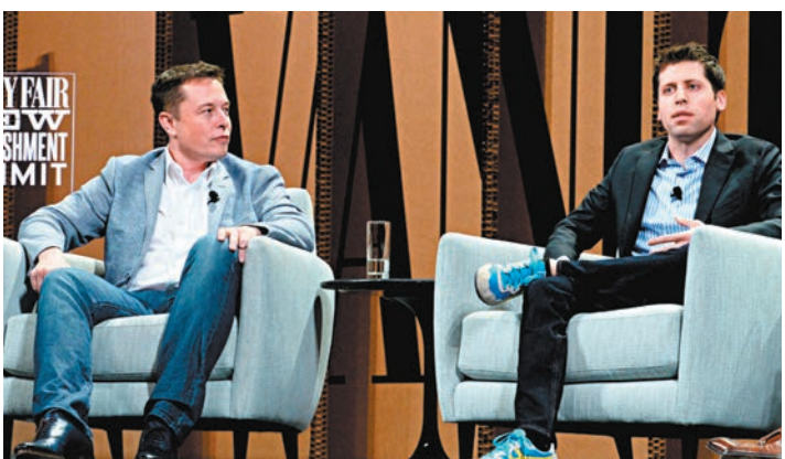
◆馬斯克(左)2015年與奧爾特曼等人創立OpenAI，協議要以人類利益至上。

OpenAI的聊天機械人ChatGPT在前年11月推出後，被多數公司用於執行從總結文檔到編寫電腦程式碼等各種任務，半年內成為全球增長最快的應用程式，引發大型科企之間的競賽，爭相推出生成式AI產品。