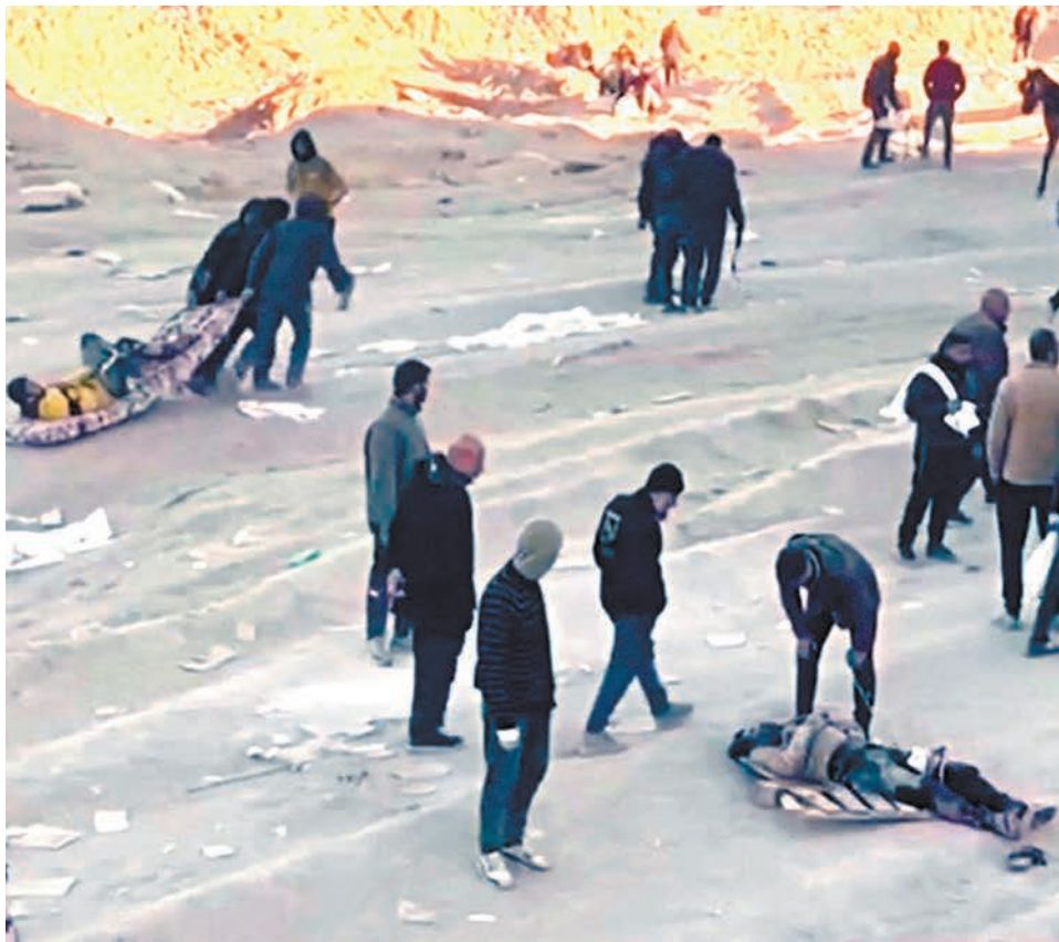
◆巴人排隊領取救援物資淪為以軍「獵物」，民眾用床墊將傷者送院救治。

勒斯坦武裝組織哈馬斯否認以方說法，強調加沙衛生部提供了「不可否認的證據」，表明以軍向手無寸鐵、沒有威脅的平民開槍，甚至直接擊中頭部。哈馬斯亦警告，他們不會允許停火協議談判成為「敵人繼續犯罪的掩護」。