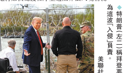
◆特朗普(左)稱拜登要為這波「入侵」負責。

不如加入我，或是我加入你一同請國會通過這項兩黨安全法案。」他還稱，他提議的措施將加快庇護程序並遏阻非法入境情況。