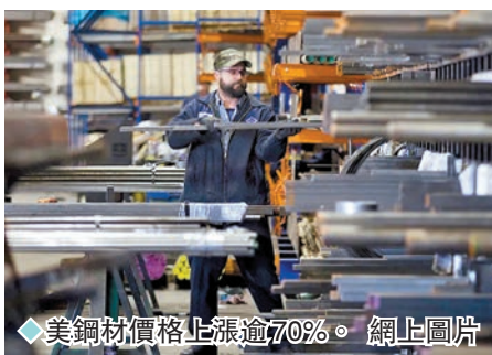
◆美鋼材價格上漲逾70%。

導體工廠,所需各類零部件的供應鏈多集中在東亞,但按照美方的規定,大部分零部件須來自美國供應商,才能獲得補貼。