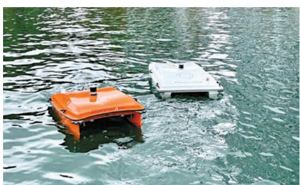
◆垃圾收集船移動緩慢,不會傷害水禽。成小智攝