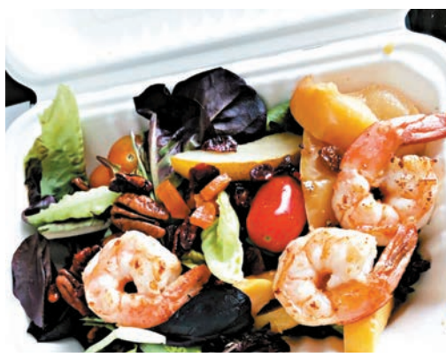
◆食肆必須在顧客沒自備器具下,才提供即棄用具。

若果經營者經過當局多次勸告仍違例,他們將會遭到檢控,罰款以500加元(約2,882港元)作為起點。