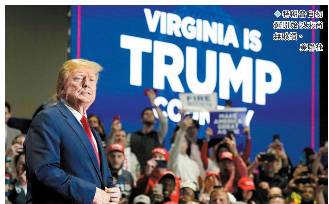
◆ 特朗普自初選開始以來尚無敗績。

香港文匯報訊 過去一年，特朗普被4次起訴及面對3宗民事訴訟，本月25日他將面臨首宗刑事案件審訊。特朗普常以口沒遮攔形象示人，即使以被告身份出庭時亦咄咄逼人，不時叫罵主審法官，或指示辯護律師故意提出反對，他這種在庭上「不守紀律」的行事模式，料會令辯護團隊頭痛不已，甚至導致出現不利的裁決結果，令特朗普成為「自己最大的敵人」。