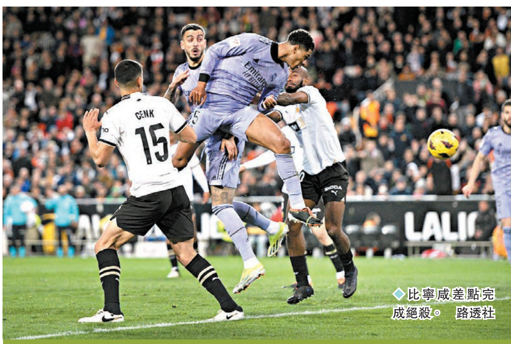
◆比寧威差點完成絕殺。