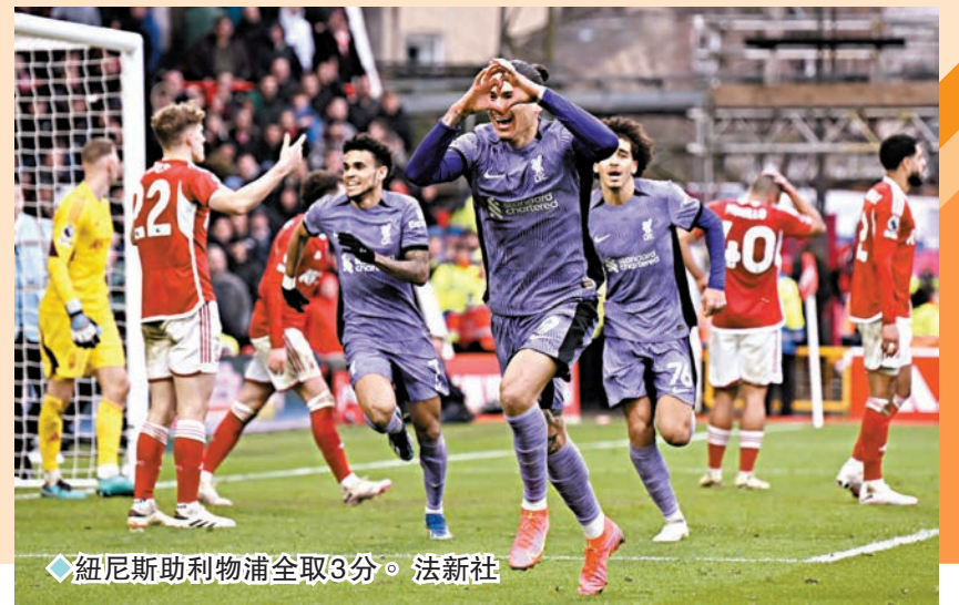
◆紐尼助利物浦全取3分。

「絕殺」機會；據報，森林的希臘班主馬連拿基斯賽後十分不滿，更一度想衝入球證更衣室理論，但最終被保安制止。至於森林領隊紐奴則表示：「不要逼我討論球證了，只能說我對此感到失望和沮喪。」 同日其餘英超比賽，正在爭逐前四的阿士東維拉和熱刺，分別作客3:2擊敗盧頓，以及主場3:1勇挫水晶宮。維拉賽後以27戰得55分排第4位，熱刺則以26戰得50分排第5位。此外，車路士同日作客僅以2:2賽和賓福特，令領隊普捷天奴的帥位更為不穩。