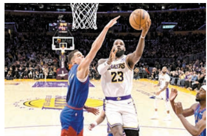
◆占士(右)上籃得手令個人得分突破4萬。

NBA 超級球星勒邦占士在昨天湖人對金塊之戰，於第2節比賽剩下10分39秒時，切入上籃得手拿下兩分，正式成為NBA史上首名生涯總得分達4萬大關的球員。 賽前，占士生涯總得分便已達3萬9,991分，僅差9分就能締造生涯4萬分的空前紀錄。去年2月8日，占士正式超越「天勾」渣巴成為NBA史上得分王，現年39歲的他今次更達成生涯總得分超越4萬分的壯舉；更難得的是，占士僅用1,475場比