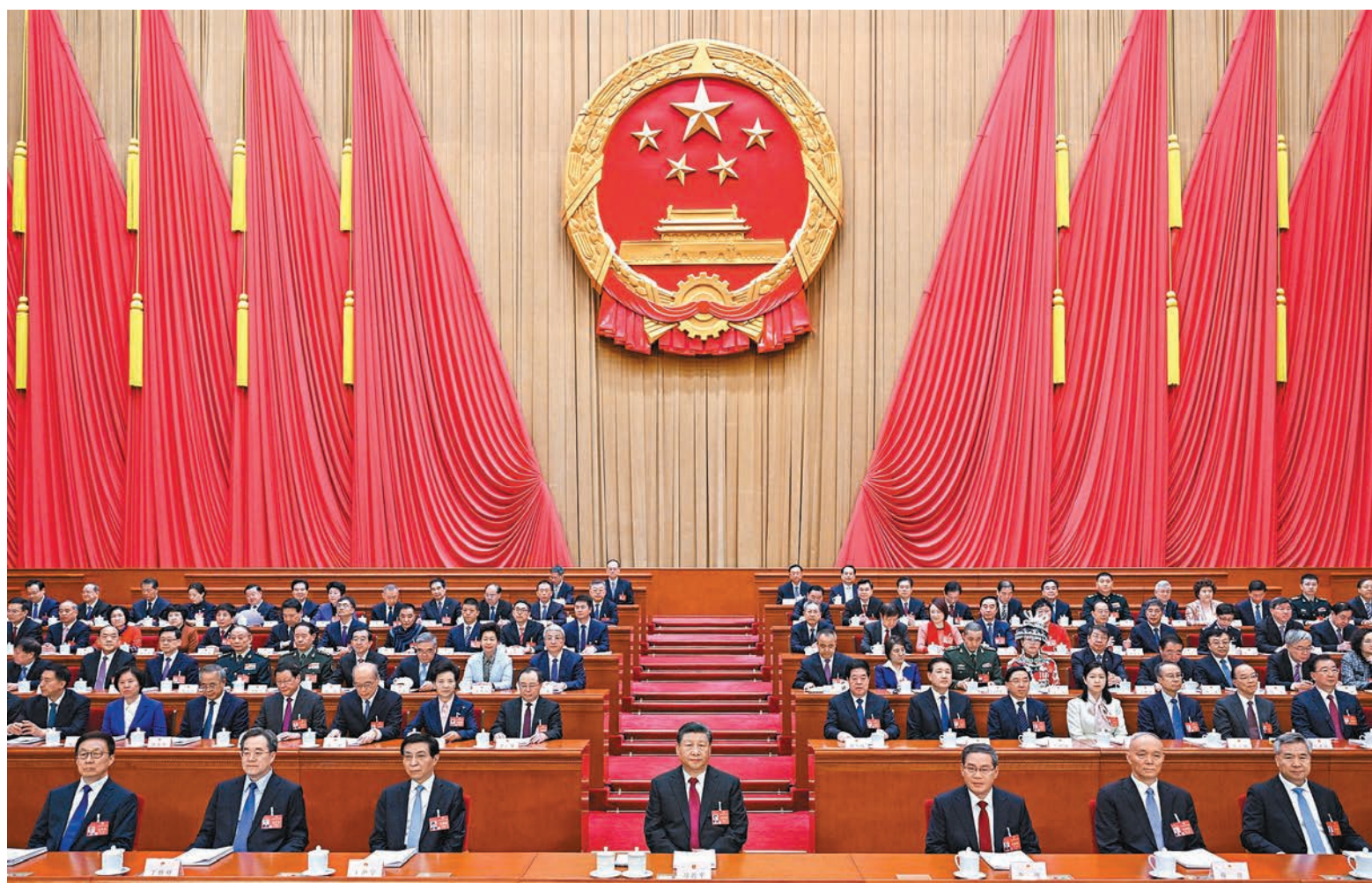
◆3月5日，第十四屆全國人民代表大會第二次會議在北京人民大會堂開幕。黨和國家領導人習近平、李強、王滬寧、蔡奇、丁薛祥、李希、韓正等出席大會。

香港文匯報訊（綜合記者海巖和新華社報道）十四屆全國人大二次會議5日上午9時在人民大會堂開幕。國務院總理李強代表國務院，向大會作政府工作報告。穩增長仍是2024年的重要任務，政府工作報告將2024年國內生產總值（GDP）增長目標繼續設定為5%左右。為實現穩增長等政策目標，今年財政赤字率繼續按3%安排，首次推出超長期特別國債，今年先發行1萬億元（人民幣，下同），同時地方政府新增專項債券規模小幅增至3.9萬億元，體現積極財政政策適度加力、提質增效的政策基調。