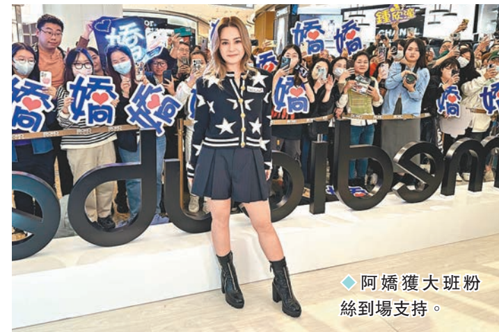
◆阿嬌獲大班粉絲到場支持。

香港文匯報訊（記者 子棠）鍾欣潼（阿嬌）年初為了應付14場Twins紅館演唱會元氣大傷，前晚她出席韓國美容品牌宣傳活動時，表示經過休息、努力食和睡後，身體雖然尚未完全復原，但狀態有好轉。