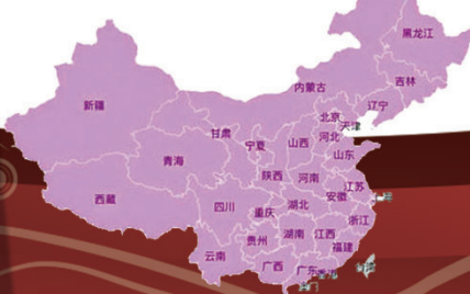
◆《周處除三害》在內地各省皆是日票房冠軍。