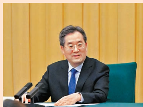
◆丁薛祥參加港澳地區全國政協委員聯組會。