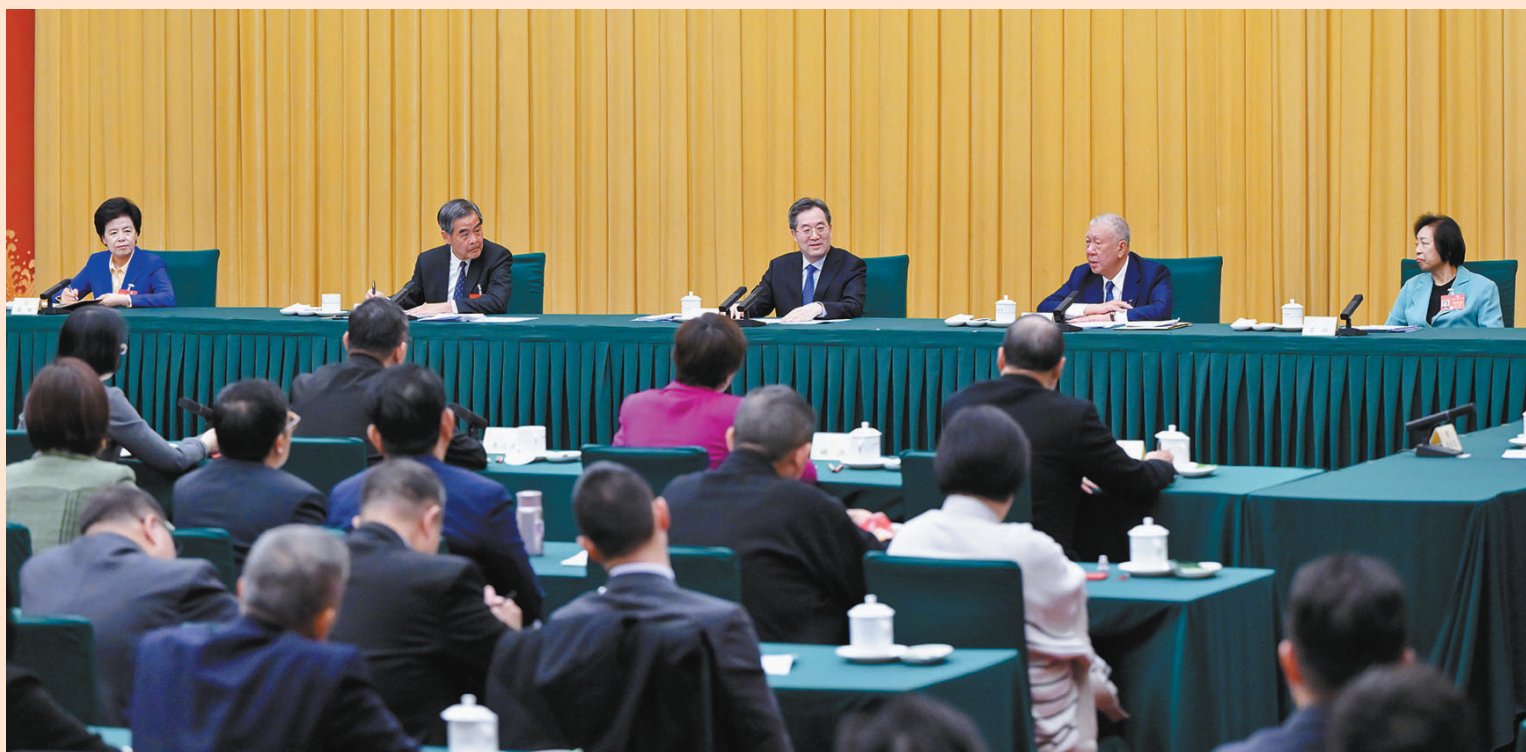
◆3月6日，中共中央政治局常委、國務院副總理丁薛祥參加全國政協十四屆二次會議港澳地區全國政協委員聯組會。