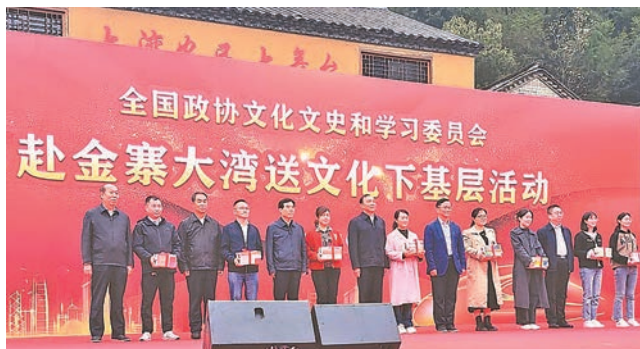
◆2023年10月10日至14日，全國政協文化文史和學習委員會赴安徽省金寨縣大灣村開展委員履職「服務為民——送文化下基層」活動。(人民政協報)

廣大政協委員切實把實現中共二十大確定的目標任務作為履職着力重點，鑰定中國式現代化目標任務，聚焦經濟建設這一中心工作和高質量發展這一首要任務，以高度的政治責任感和歷史使命感積極參與各類協商議政活動和履職實踐，取得了豐碩的履職成果。