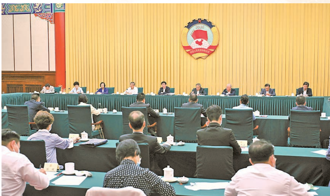
◆2023年，全國政協共召開14場雙周協商座談會。圖為2023年8月25日，十四屆全國政協第九次雙周協商座談會在北京召開，會議圍繞「促進港澳青年更好融入國家發展大局」協商議政。

一年來，廣大政協委員聚焦「十四五」規劃實施中的重大問題開展了多項專項監督，並形成監督報告。切實把民主監督同調查研究、反映社情民意資訊等人民政協經常性履職實踐結合起來，務實提出意見建議，做到情況真實準確、立論有理有據、建議具體可行，把民主監督的過程變成及時反映情況、深入研究問題、