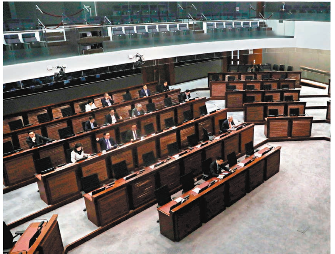
◆立法會研究與基本法第二十三條立法相關的事宜小組委員會昨日舉行會議。

特區政府昨日下午公布，行政長官會同行政會議昨日（7日）決定將《維護國家安全條例草案》今日刊憲並提交立法會審議，以全面落實基本法第二十三條、《全國人民代表大會關於建立健全香港特別行政區維護國家安全的法律制度和執行機制的決定》（下稱「人大決定」）及香港國安法所規定的憲制責任，確保可早日有效維護國家安全。