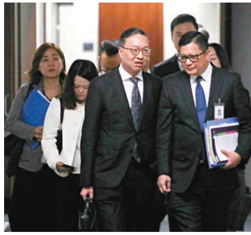
◆林定國和鄧炳強昨日出席立法會相關小組會議。