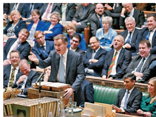
亨特在國會發表預算案時七情上面。

以來最高水平。工黨為此指責保守黨忽視其執政14年來的「經濟失敗」，工黨領袖斯塔默稱，這份預算案是「失敗政黨最後的絕望之舉」，「經濟規模較保守黨籍首相2010年入主唐寧街時還要小，經過14年執政後，保守黨實際上認為誰人會感到有所改善？」