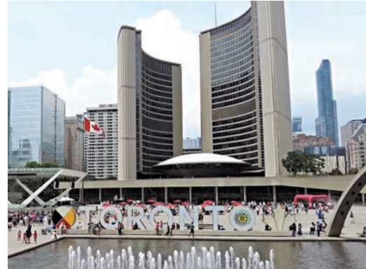
加拿大各級政府主動改善男女員工薪酬差距。

全國最頂尖企業行政總裁每小時賺取7,162加元(約4.15萬港元)，代表着他們工作少過9小時，已可賺獲一般受薪階層的年薪6.1萬加元(約35.3萬港元)。在私營部門，頂尖階層的薪酬是「沒有極限」。