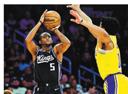
◆迪艾朗霍斯投球。

美職籃(NBA)昨天的常規賽，洛杉磯湖人雖然首節一度領先19分，但最終仍以120:130主場負於薩克拉門托帝王，賽後以34勝30負排名西岸第10，帝王則以35勝26負排第7。勒邦占士為湖人貢獻31分，還是敵不過攻入全場最高44分的迪艾朗霍斯。 ◆綜合外電