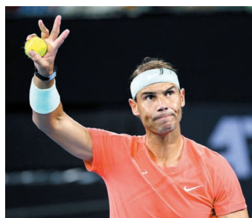
◆拿度退出印第安韋爾斯網賽。資料圖片

據台媒引述法新社報道，因傷退出1月澳洲公開賽的西班牙網球名將拿度，原定在印第安韋爾斯網球賽強勢回歸，但原定今天比賽的他突然發布聲明，透露復原狀況無法應付高強度賽事，只能忍痛退出。數天前才與小將艾卡卡斯打了一場表演賽的拿度表示：「作出這(退賽)決定並不容易；老實說真的很難，但我不能對自己說謊，也不能對千萬萬的粉絲說假話。」拿度因腹部等傷勢，2023年賽季幾乎全部缺席，本季至今只參加了布里斯班國際網賽，卻又告體部傷勢復發而退出澳網。 ◆綜合外電