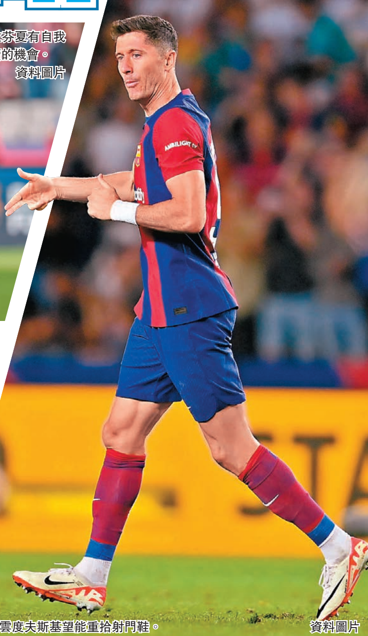
◆羅拔利雲度夫斯望能重拾射門鞋。資料圖片