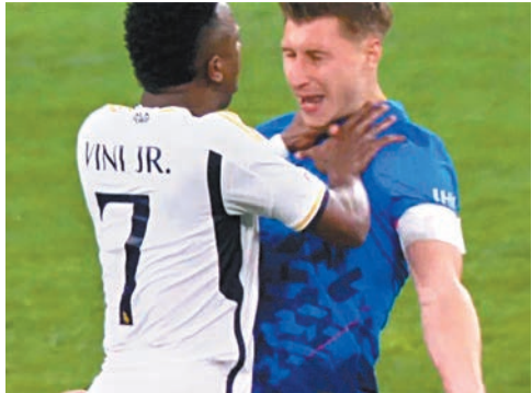
◆雲尼斯奧斯又頸一幕。