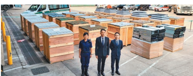
◆海關截獲兩艘走私內河船，檢獲逾兩億元貨品。

香港文匯報訊(記者蕭景源)私梟近日利用內河船，借大霧天氣掩護，在黃昏及深夜能見度低時走私，海關3日內破獲兩宗案件，檢獲貨品總值逾2.11億元，當中包括高價保健食品「鹿胎素膠囊」，估計該些保健品被偷運到內地後，每樽售價高達5,000元人民幣，避稅近3,000萬元。海關發現有境外「中介人」操控本港「空殼公司」走私貨物，以逃避執法人員追捕，海關正追查