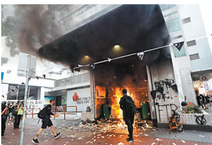
◆2019年10月1日大批暴徒在灣仔一帶打砸燒暴動。資料圖片

香港文匯報訊(記者葛婷)2019年10月1日，「民陣」在港島發起非法遊行，引發各區打砸燒暴動。其中兩名男子被控暴動及拒捕，受審後被裁定罪成，昨日分別被判囚4年6個月及4年1個月。區域法院暫委法官李志豪判刑指，「示威者」在油站旁投擲汽油彈，罔顧警方及市民安危，他們在舉國慶祝的日子借機挑起大眾情緒，暴行令人髮指，目的明顯不過。