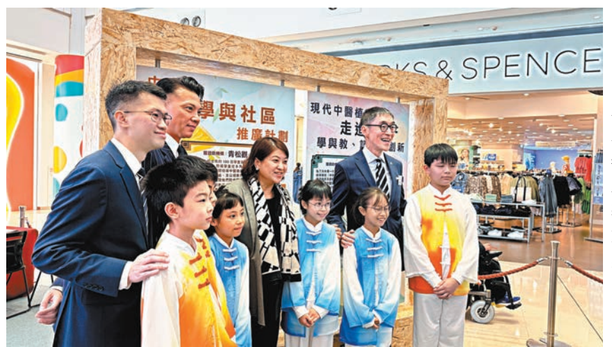
◆政府成立的中醫藥發展基金昨日一連四天舉行成果展，展示自基金起動以來的資助成果。

海關調查發現，有境外「中介人」通過香港的「空殼公司」遙控走私，該公司登記人秘書公司，並無實際業務。相信兩批走私貨最終目的地都是內地，若成功進入內地，可逃避稅款約一億元。