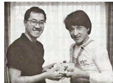
成龍在微博貼上與鳥山明的合照留言哀悼。