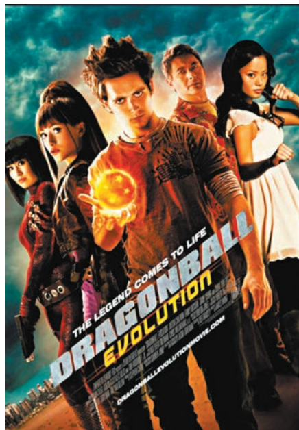
周潤發有份參演《龍珠：全新進化》。

鳥山明的作品衝出國際，作為影響無數年輕人的漫畫家，鳥山明逝世的消息引起全球轟動，粉絲哀號留言：「一個時代的終結」、「謝謝鳥山明老師帶給很多兒時回憶」；有香港粉絲更想起《龍珠》的情節，以當中情節悼念鳥山明，「大家集氣」、「集齊七粒龍珠，求龍神將鳥山明復活」！