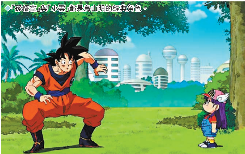
「孫悟空」與「小雲」都是鳥山明的經典角色。

鳥山明的工作室昨日發聲明表示，鳥山明於3月1日因急性硬腦膜下血腫逝世，終年68歲。聲明中提到，鳥山明創作逾45年，感謝世界各地不同人士的支持，「衷心希望鳥山明獨特的作品世界，在未來的歲月裏能繼續受到大家的喜愛」。又透露已舉行葬禮，僅限親屬參加，應鳥山明希望享有寧靜的意願，謝絕弔唁、香典、祭品、花圈等。