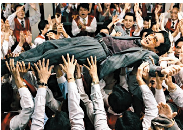
▲梁朝偉憑《金手指》角逐最佳男主角獎。