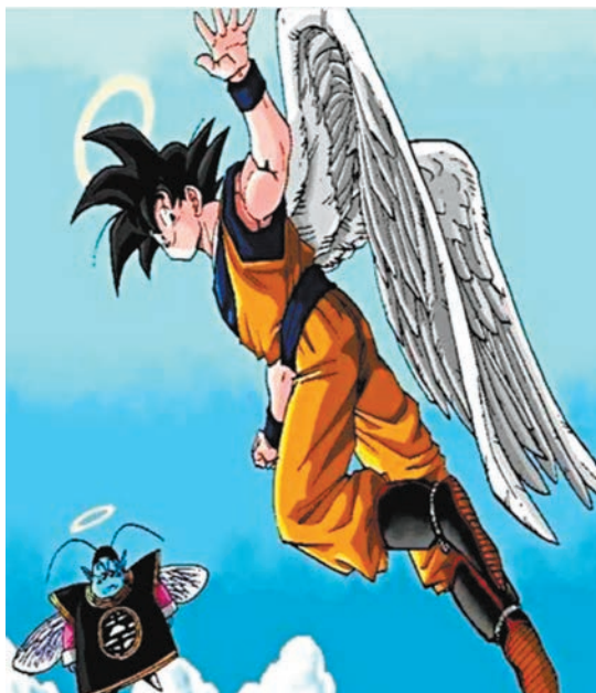
《龍珠》借鑒了中國《西遊記》的故事作為背景。網上圖片