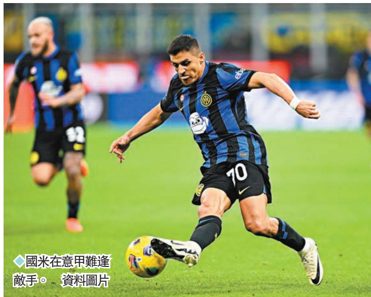
◆國米在意甲難逢敵手。

德甲方面，拜仁慕尼黑將主場對緬恩斯。拜仁落後榜首利華古遜達10分，如今場再失分已接近可宣布投降，在主場出擊下相信有力言勝。(now639台今晚10:30p.m.直播)