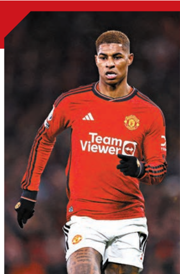
◆曼聯前鋒拉舒福特近期頗有入球。 資料圖片

有丹祖馬和迪利阿里等傷兵的愛華頓由於早早上訴成功，其違反財政公平條款的罰分由10分減為6分，故目前可以27戰得25分進佔聯賽榜尾5位置，領先尾3的盧頓5分。然而，愛華頓踏入2024年演出其實十分差勁，出戰10場比賽僅得1勝，上次贏波已是1月18日對水晶宮，近況差勁下是晚出訪奧脫福球場，相信很難可全身而退。