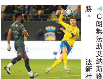
勝。C朗無法助艾納斯獲勝。

有C朗拿度和沙迪奧文尼等壓陣的艾納斯，於昨日沙特阿拉伯聯賽卻主場意外以1:3不敵艾拉德；艾納斯賽後僅以23戰得53分排聯賽次席，落後榜首希拉爾9分並多打一場，爭冠形勢欠佳。 ◆綜合外電