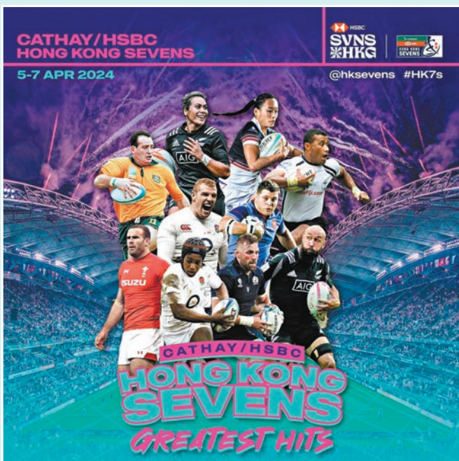
◆香港七欖尚有不足一個月便展開。

女子組方面，A組由新西蘭領銜，同組有法國、巴西及英國，澳洲隊位列B組首號種子，同組包括南非、愛爾蘭及斐濟，暫列積分榜第4位的美國編在C組，與加拿大、日本及西班牙同處一組。