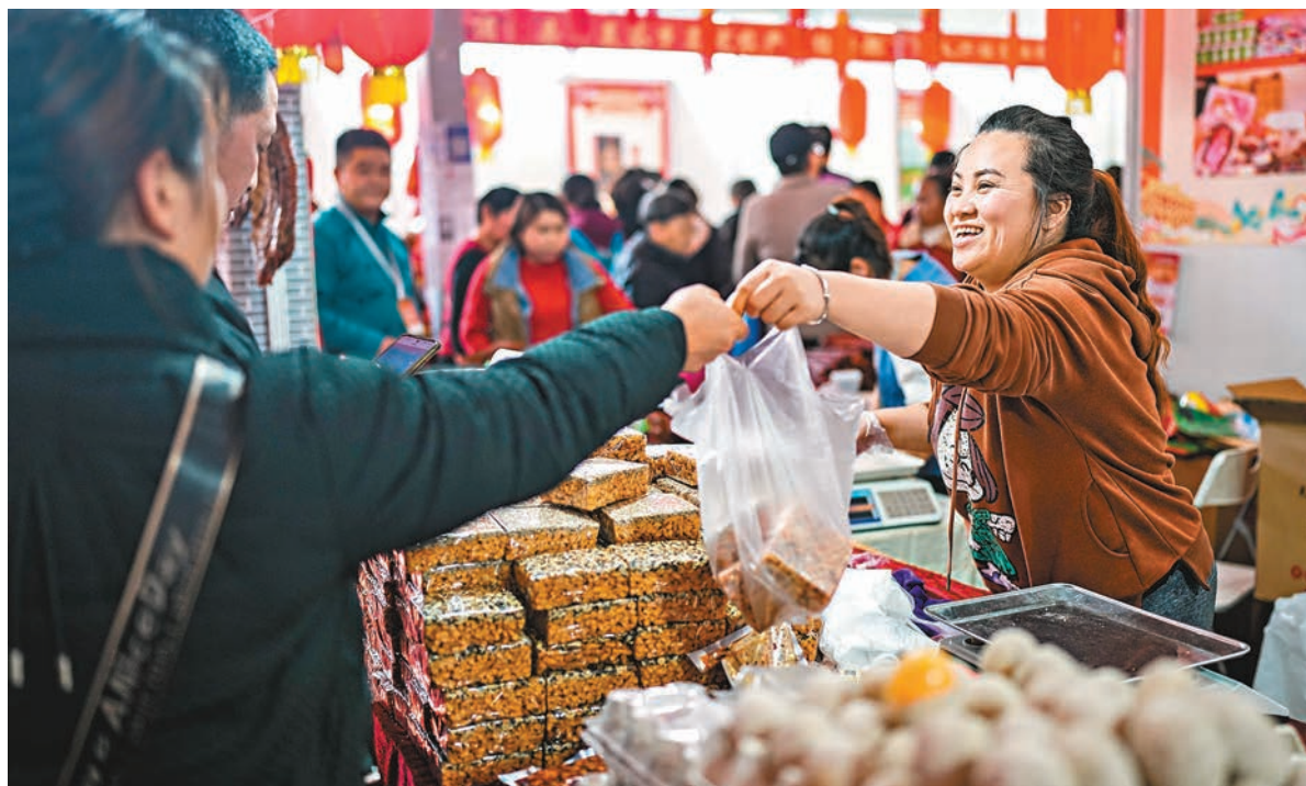
◆春節期間鮮菜、豬肉、水產品、鮮果等食品價格季節性上漲，2月CPI同比和環比大幅回升。圖為春節期間，商戶在位於貴陽的新春年貨節現場將商品遞到市民手中。資料圖片

前海開源基金首席經濟學家楊德龍則強調，CPI同比明顯回升，主要受到需求的拉動，顯示需求端回升，經濟復甦預期不斷增強。