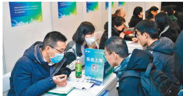
◆3月9日，2024年「樂業上海優+」春季促進就業專項行動大型招聘會暨高校畢業生擇業對接會在上海舉行。