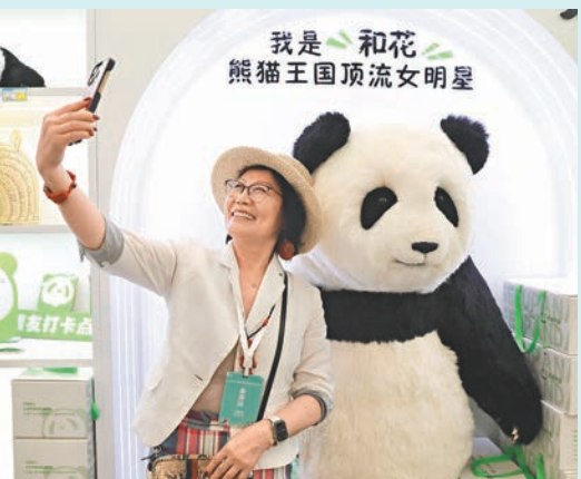
◆目前「全球人氣大熊貓排行榜」位居榜首的「新晉頂流」和花深受大家喜愛。圖爲遊客與大熊貓和花玩偶合影。資料圖片