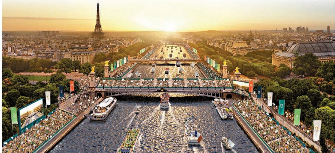
◆巴黎奧運開幕式的預想圖。資料圖片

據法國內政部介紹，為安全起見，開幕式前後及舉辦過程中，法國政府將關閉以巴黎為中心、半徑150公里範圍內所有機場和領空。另外，法國安全部門已着手對約100萬人展開風險篩查，其中包括運動員、記者、私人保安以及居住在關鍵基礎設施附近的人。 ◆新華社