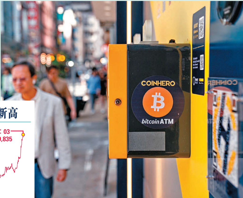
◆隨著今年1月多隻現貨比特幣指數股票型基金獲准上市交易，比特幣行業結束長達18個月寒冬期。