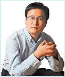
宋清輝 著名經濟學家

中國經濟多年來成為世界經濟發展的重要支撐力量，靠的是踏實能幹的中國人民在習近平主席的正確領導下「撻起袖子加油幹」。國家統計局今年2月29日發布的2023年國民經濟和社會發展統計公報，在更加清晰地向世界展示了2023年中國經濟社會發展成績的同時，進一步佐證了中國經濟強勁的韌性和不竭的動力，中國經濟未來將繼續高質量發展。