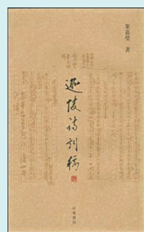
《迦陵詩詞稿》 作者：葉嘉瑩 出版社：中華書局