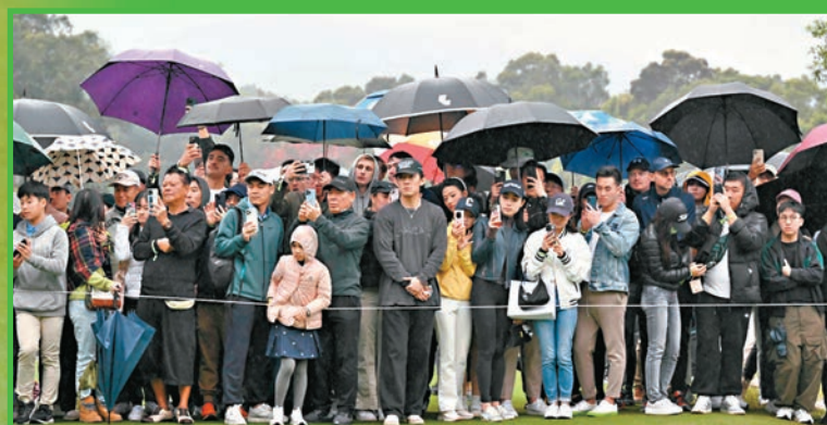
雖然昨日下午有雨，但無阻入場球迷熱情。