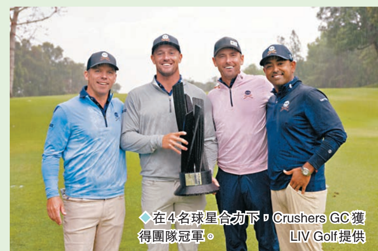
◆在4名球星合力下，Crushers GC獲得團隊冠軍。

連三日的LIV Golf首度在香港舉行即大受歡迎，賽事吸引不少海內外球迷前往粉嶺高球場欣賞比賽，雖然煞科日天涼有雨，不過仍無礙球迷們欣賞世界級球手作賽的熱情，有球迷更早於開賽前兩小時到場排隊，有觀眾形容今次賽事為今年為止最成功的體育盛事：「粉嶺高球場是一個質素很好的場地，而且香港有很多高爾夫球迷，氣氛非常好，今次賽事亦吸引了很多世界級球手來港比賽，希望2025年全運會高爾夫球項目能在香港舉辦。」