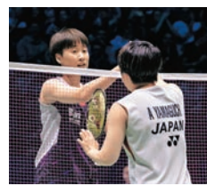
◆陳雨菲(左)與山口茜在賽後致意。

2024年法國羽毛球公開賽日前結束了準決賽爭奪，2號種子石宇奇在男單準決賽對陣印尼選手瓦多約，石宇奇最終連勝兩局，與泰國選手昆拉武特會師決賽。女雙頭號種子陳清晨/賈一凡，以2:0橫掃日本組合松本麻佑/永原和可那入決賽。混雙方面，中國隊兩對組合在準決賽相遇，最終馮彥哲/黃東萍以2:1勇挫衛冕的蔣振邦/魏雅欣。女單準決賽中，中國隊選手陳雨菲則經過3局苦戰，以1:2不敵日本選手山口茜無緣決賽。