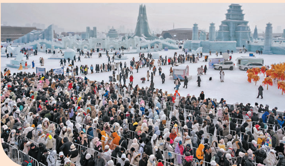
◆文化和旅遊部數據顯示，春節長假期間，中國出遊的人數達到了4.7億人次。圖為早前，遊客在哈爾濱冰雪大世界園區排隊，等待體驗超級冰滑梯。