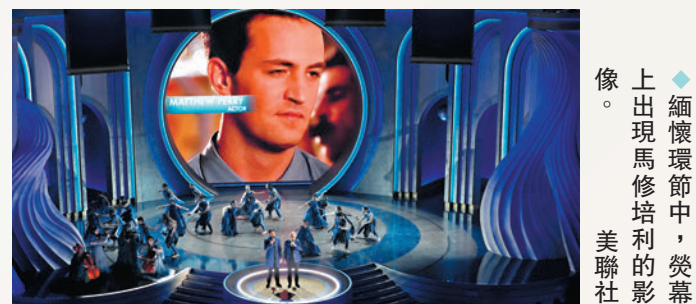
◆緬懷環節中，榮耀上出現馬修培利的影像。