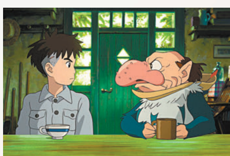
◆《蒼鷺與少年》奪得最佳動畫電影獎。

出來他確實很想要」。問宮崎駿本人為何沒有公開發表感言，鈴木敏夫搞笑提及宮崎駿在《風起》時造成轟動的引退宣言，「舉辦那麼大的記者會說自己『不會再做了』，很長一段時間，他一直被說是放羊的孩子，說自己會退休，但是又再度回來，現在還在深深反省中」，但也補充道「不過他總是抱着必死的覺悟來對待他的工作」。談到下部作品進度，製作人鈴木表示：「現在還只是一張白紙，可能還需要10年的時間，製作長片真的是非常困難的事情，現在還有點累，想