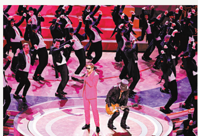
◆賴恩高斯寧表演《I'm Just Ken》，high爆全場。

奧斯卡頒獎典禮依循傳統，致敬了多位已故名人和影人，並邀請意大利著名男高音Andrea Bocelli及其兒子Matteo Bocelli登台，一同獻唱歌曲《Time to say goodbye》，場面感人。當晚緬懷已故藝人的表演中，包括了美國著名處境喜劇《老友記》主角之一馬修培利(Matthew Perry)、搖滾巨星Tina Turner、《哈利波特》「校長」Michael Gambon，以及日本音樂大師坂本龍一和韓星李善均等都一一出現在背景熒幕上，令人鼻酸。值得一提的是，今年香港沒有任何媒體直播奧斯卡，但香港觀眾仍可透過奧斯卡大會今年增設的官方手語直播觀看。