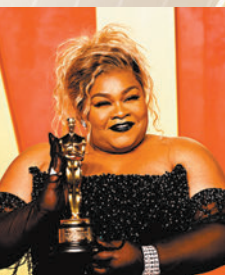
◆多薇喬伊藍道夫獲最佳女配角。